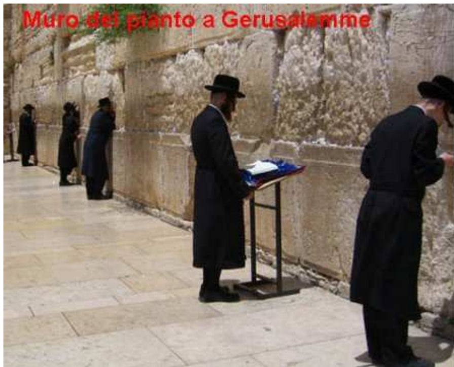
Muro del pianto a Gerusalemme