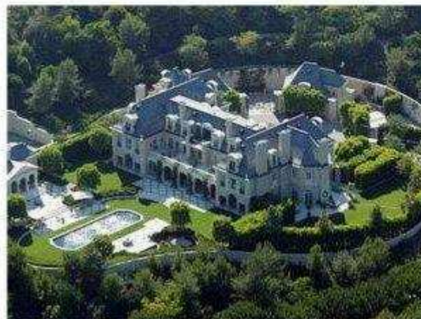
secondo la rendita catastale dell'IMU