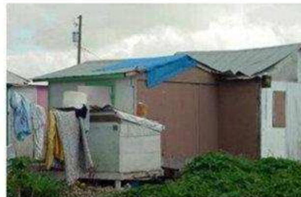
dalla banca ...