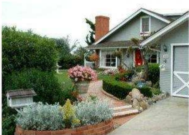
La propria casa vista dal proprietario...