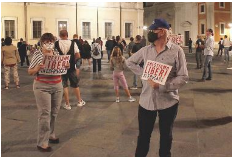
La veglia in piazza del Popolo. Sotto, manifestazione in piazzetta Gandhi

Sempre mercoledì sera, ma in piazzetta Gandhi, si è svolta la contromanifestazione organizzata da Arcigay per «dare voce al rispetto».