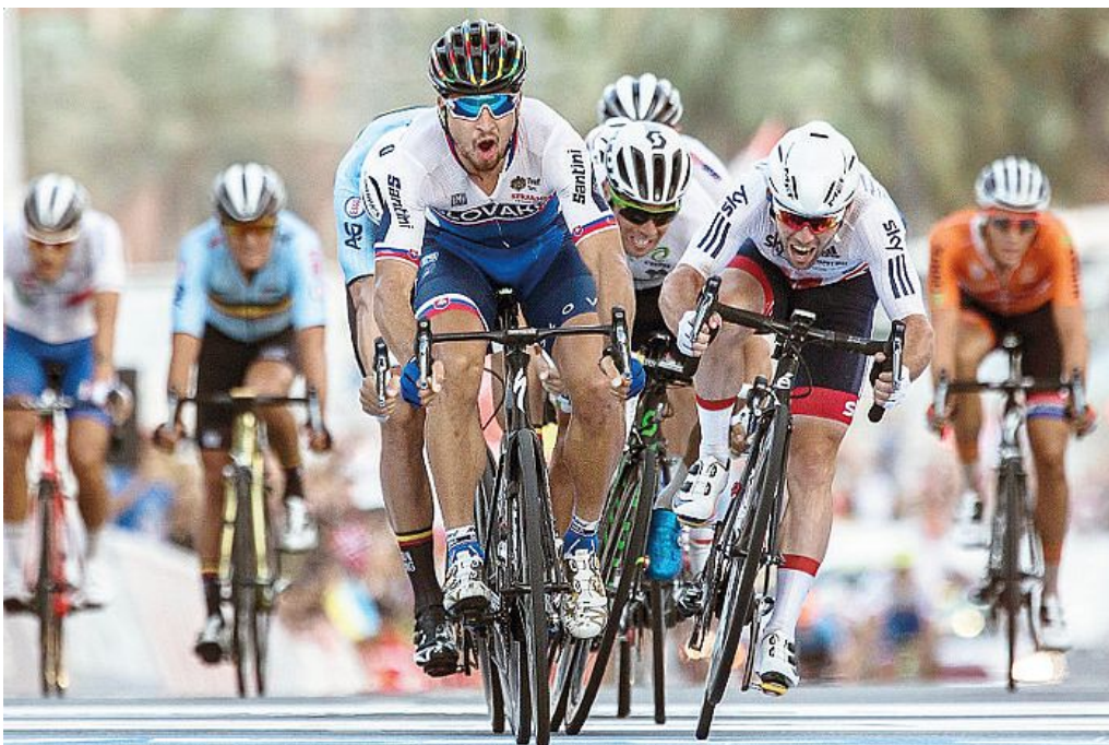
Lo sprint vincente di Peter Sagan sul traguardo di Doha

France, dove ha vestito la maglia gialla e conquistato quella verde. Poi, sempre in Francia, un mese fa ha vinto la prova in linea della prima edizione degli Europei. Insomma un dominatore della corsa di un giorno, che quest'anno si è anche divertito a