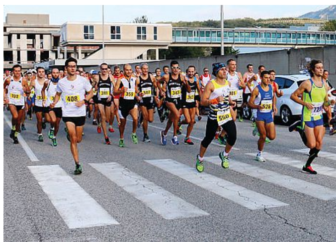
Il via della "Su e zo pei clanz"