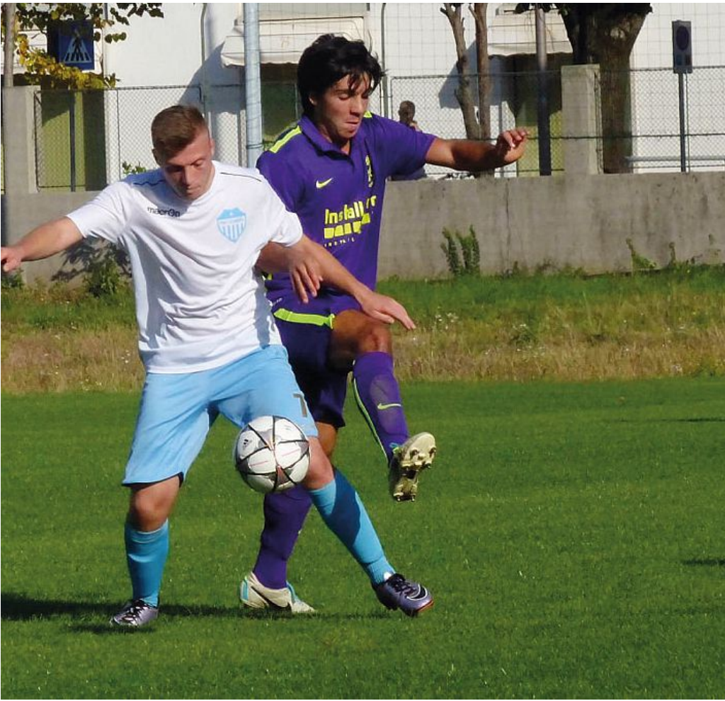
Un momento dell'incontro tra Pro Gorizia e Zaule

Bozic ci prova da fuori senza fortuna alla mezz'ora, mentre è molto più incisivo il destro di Girardini dentro l'area biancoazzurra al 33': Maurig immobile, palo interno e sfera che non entra dopo aver danzato quasi sulla linea. Il primo tempo si chiude con questa clamorosa emozione. Il secondo si apre con la doccia fredda per i padroni di casa. Al 5' Sculac calcia una punizione da posizione defilata, e nel caos in area Marchio la sfiora di quel che basta per mettere fuori causa Maurig per lo 0-1. E' lo schiaffo che scuote la Pro. Coceani inserisce Spanghero e Selva, e quest'ultimo lo ripaga subito con la girata volante nell'area piccola che vale il pari. E' il 14', e la Pro Gorizia ora domina. Al 16' Cantarutti svirgola alta una palla a due passi dalla porta sguarnita, ma due mi-