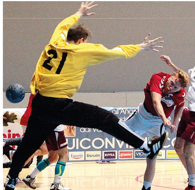
Una rete del Principe contro Cassano Magnago