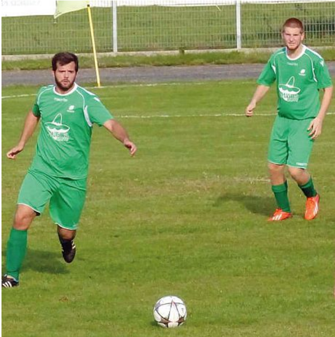
Disco rosso in casa per il San Luigi