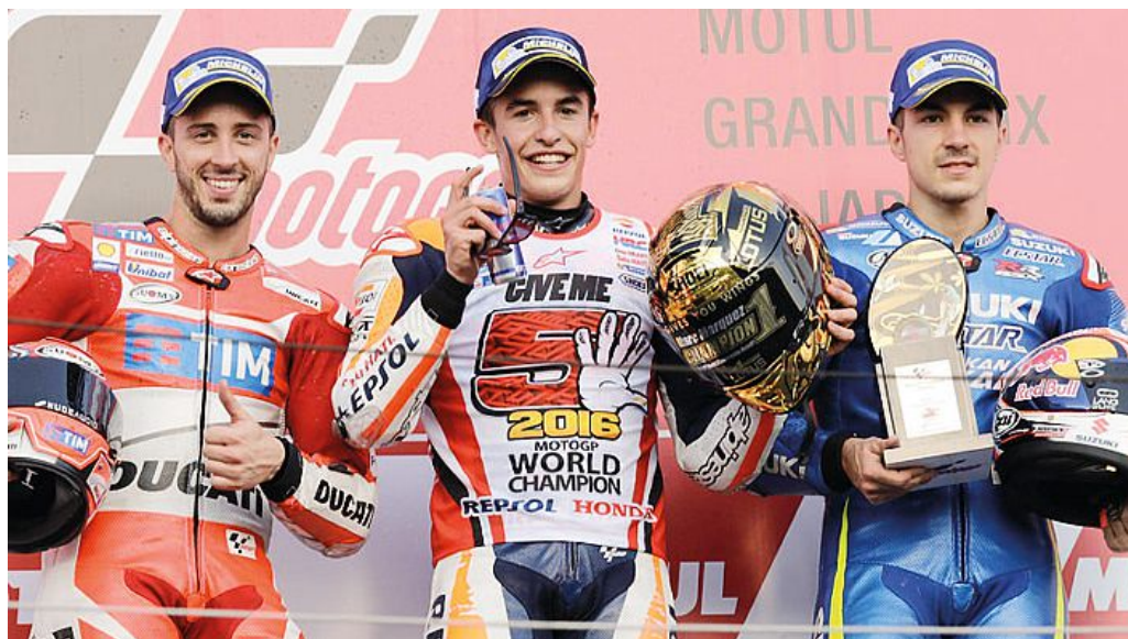
Marc Marquez sul podio del Gp del Giappone tra Dovizioso e Viñales

«Ho avuto un po' di c...», ammette felice Marquez, che dedica il trionfo alla nonna, morta pochi mesi fa. È festa grande per la Honda che, invece della temuta debacle e dopo la gran paura per Pedrosa, umilia una Yamaha sensibile alle nuove gomme e annulla le pur ridotte speranze di Rossi di agguantare il decimo mondiale. A 38 anni, nel 2017, la caccia sarà ancora più dura. Niente al semaforo verde lascia presagire un colpo di scena. Rossi, in pole, Marquez e Lorenzo danno subito battaglia, ma presto l'Honda è davanti a tutti. L'italiano passa Lorenzo ma poi osa troppo, per-