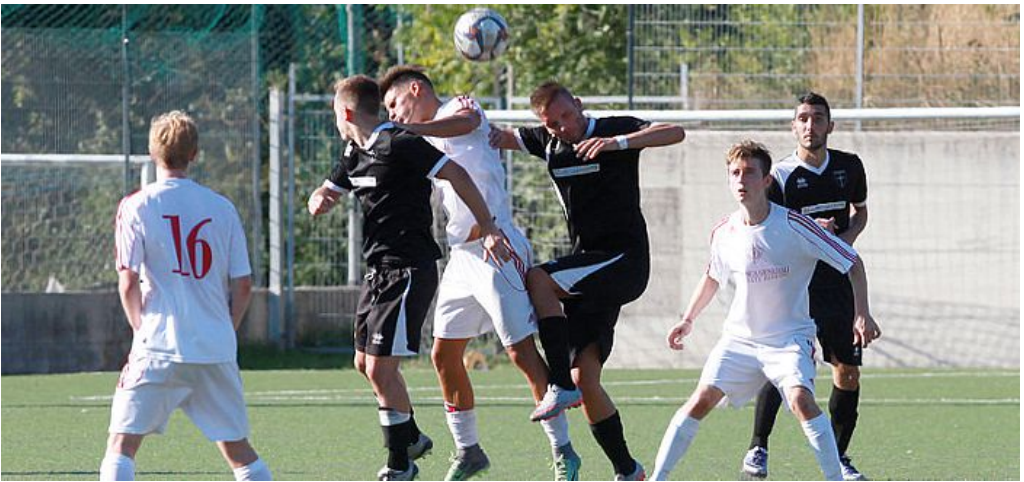
Una recente gara del Costalunga

La Pro Cervignano riesce a imporsi sul campo della Valnatisone con una rete realizzata al 29' del secondo tempo da Llani complice una deviazione di schiena di un difensore. Un finale casuale al tgermine di una gara che non ha regalato emozioni indimenticabili e poteva risolversi solo con un episodio casuale, come appunto è successo. Nella prima frazione di gara non si registrano occasioni su entrambi i fronti, le squa-