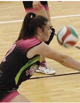
San Sergio in ricezione