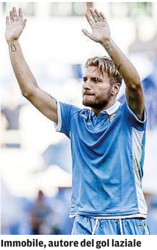
Immobile, autore del gol laziale