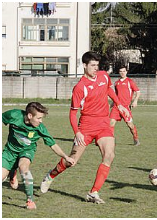
Una recente gara del Ronchi

sa si muove sul fronte isontino. E in effetti, come d'incanto, smessi gli abiti umili e riservati dimostrati sin qua, l'undici di Franti si riscopre d'indole guerriera iniziando quell'auspicato ed esortato lavorio ai fianchi, che condurrà al pari nonostante l'evidente diniego di un super Sorrentino, mirabolante in diversi interventi specie su Markic e Dallan al 24'. Nulla da fare invece per il guardiano al 35', allorché quando per un fallo di Scommegna in area la trasformazione dal dischetto di Markic lo trafiggerà. Nella ripresa dopo un avvio poderoso dei padroni di casa e un ritorno di fiamma giuliano, al 35' i padroni fruiscono di un secondo penalty, ma nella circostanza il sempre deputato Markic fa esaltare le qualità acrobatiche di Sorrentino, che vola a smannacciare e mortificare il numero 8, certo del sorpasso. Rimandato, ma legittimo per i valori emersi in campo al 41' per merito del trottolino Gabrieli bravo a smarcarsi, raccogliere la sfera inviatagli da Piagno e battere con estrema freddezza l'estremo. Moreno Marcatti