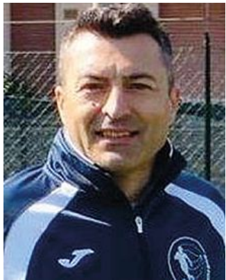
Lugnan può sorridere