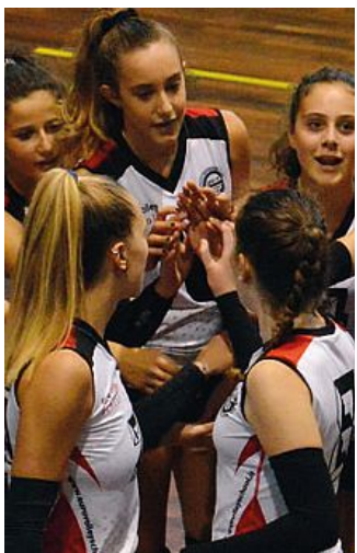
Le ragazze dell'Evs salutano

Serie C donne: il Trivignano nel finale spegne la luce alle ragazze di Sparello