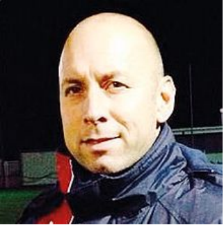
Il tecnico della Gradese CragnoLin

Arbitro: Schiozzi di Gorizia Marcatori: 12' pt Mosca (G), 35' pt Petrucco (S), 40' pt Ulliani (G), 12' st rig. Petrucco (S), 23' st Crevatin (S) Note: ammoniti Cauler, Petrucco, Laurenti, Troian