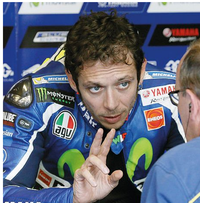
Caduta e ritiro per Valentino Rossi

livello della Yamaha, almeno non a inizio stagione, ma lui ha saputo trarne il meglio, costringendo due fuoriclasse come Rossi e Lorenzo a cercare una disperata rimonta nelle ultime quattro gare, subito fallita. La Yamaha, spesso in crisi nella gestione delle Michelin, un problema denunciato anche dai ducattisti Dovizioso e Iannone, ha tradito i suoi piloti costretti spesso a guidare al limite per tener testa a Marquez. Una doppia caduta come quella di Motegi non si ricordava da tempo, un disastro che abbatte Lorenzo ma soprattutto Rossi. Il pesarese sperava di rosciare qualche punto invece si trova a masticare amaro: «È un gran peccato andare a casa a mani vuote - dichiara - Potevo fare una bella gara, anche se con Marquez sarebbe stato difficile. Non mi aspet-