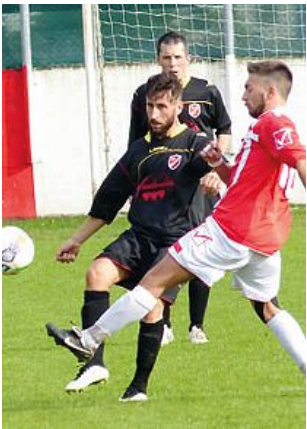
Un'azione della Juventina

è costretto a capitolare di fronte a Bardini, decisamente uomo partita della giornata. Il Domio ha un'ottima chance per raddrizzare le sorti del match con Puzzer, ben servito dal vivace Grando dalla destra, ma il suo tiro viene ribattuto da un difensore poco prima della linea di porta. Nella ripresa la Juventina segna lo 0-2 ancora con Bardini, abile a scacciare il pallone di prepotenza sotto la traversa dopo aver sfruttato un'errore di Morina al 5'. Poco dopo arriva il tris, firmato da Antonutti, che di punta ruba il tempo a un incerto Messi e beffa Koren. Il Domio si scioglie dopo il terzo gol incassato e colleziona alcune buone occasioni in ripartenza. Nella prima Pipan non riesce a sorprendere il portiere ospite mentre nella seconda Fichera, ancora servito da Grando, calcia alto da centro area. La Juventina non rallenta e colleziona altre occasioni culminate da un palo colpito dal solito Bardini. Pippo Morea