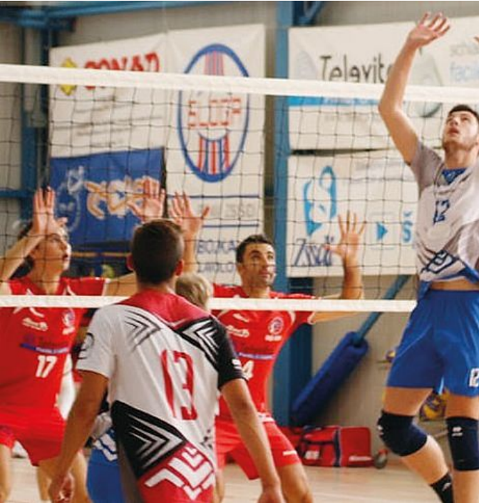
Il Televita a muro in un recente torneo

con l'Adriavolley, firma 13 punti ma si presenta soprattutto tirato e lucido dal punto di vista fisico rispetto alla passata stagione. Cuturic inserisce Ivanovic in zona-3 per Pavlovic, ma non solo: il timoniere del Tabor prova ogni arma, con i doppi cambi di diagonale (inserendo Princi e capitano Kante, ndr), e con Iaccarino per Bolognesi. Katalan, unico sempre in campo, festeggia il compleanno e la propria maggiore età con una prova maiuscola: bel piglio da esperto giocatore per un 18enne al debutto in B. Il Televita prova a rientrare in gara nel terzo set: 4-6, 13-16 e 15-18 le tappe del vantaggio ospite, ma il 6-1 del team di Meneguzzo annichilisce quanto fin lì dimostrato dai triestini: dal 21-19 i vicentini trovano la strada giusta e chiudono 3-0. RISULTATI 1a giornata: Pieramartellozzo Cordenons - Volley Treviso np, Valsugana Padova-Bibione Mare Volleyteam 3-1, Silvolley Trebaseleghe - Massanzago 3-0, Gori Wines Prata-Aduna Casalserugo 3-0, Bassano Volley - Avs Mosca Bruno Bolzano 0-3, Cba Group Arco Riva Trento - Pall. Motta TV 1-3. CLASSIFICA: Silvolley, Prata, Cornedo, Avs Bolzano, Motta e Valsugana Padova 3; Cordenons, Televita, Treviso, Bibione Mare, C9 ArcoRiva, Bassano, Massanz. e Adu-na Casalserugo PD 0.