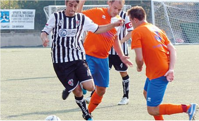
Roianese all'attacco contro il Fiumicello

Il Villesse fa centro nel primo tempo con Trampus, poi va giù pesante nella seconda frazione contro il Piedimonte: a bersaglio due volte Picco, una Biondo e una Giurissa; per gli ospiti Maurencig su penalty aveva siglato il momentaneo 2-1. Sale il Fiumicello al termine di una gara da brividi, sotto infatti per 2-0 dopo i primi quarantacinque minuti contro il San Canzian Begliano (Aristone su rigore e Stefano