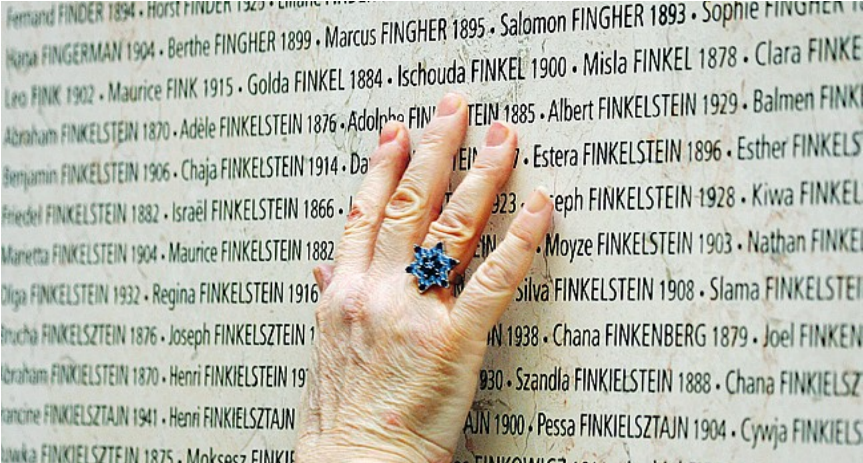
Una mano tocca i nomi e gli anni di nascita delle vittime francesi della persecuzione nazista, che sono incisi su un muro nel Memoriale della Shoah a Parigi

Quando Bauman comincia a scrivere il saggio (siamo alla fine degli anni Ottanta) già alcuni storici hanno tentato di dare una visione globale dello sterminio nazista degli ebrei, senza tuttavia interrogarsi sul «perché» fosse accaduto, ma soffermandosi in particolare a ricostruire il «come», vale a dire ricostruendo quei meccanismi amministrativi e burocratici che avevano reso possibile lo scatenarsi della violenza. In particolare, tra gli studi che Bauman sembra privilegiare, emerge il saggio storico di Raul Hilberg La distruzione degli ebrei d’Europa (che oggi torna in libreria in una nuova edizione Einaudi). Proprio l’intuizione di Hilberg di considerare in preva-