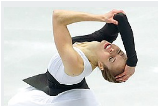
Bianconera Carolina Kostner, 29 anni, in azione ieri a Ostrava nel corto