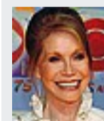
Interprete Mary Tyler Moore

Addio a Mary Tyler Moore volto celebre dei serial