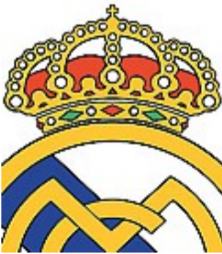
Simbolo La croce sul logo del Real

«Bisogna stare attenti», è la scusa ufficiale, «ci sono sensibilità culturali da rispettare»: per la precisione 50 milioni di sensibilissimi euro, da rispettare con un contratto quinquennale e da incassare con la