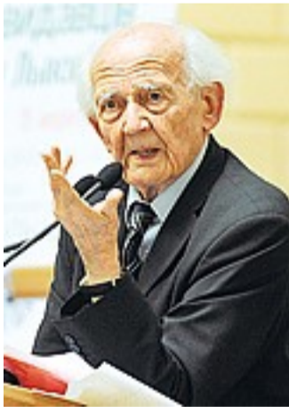
Zygmunt Bauman (1925-2017)

Le conseguenze da trarre, sono un monito: senza la civiltà moderna, non vi sarebbe stato alcun Olocausto, perché «la distruzione di massa degli ebrei non fu solo una forma estrema di antagonismo e di oppressione» o di odio collettivo. Non dimentichiamo che