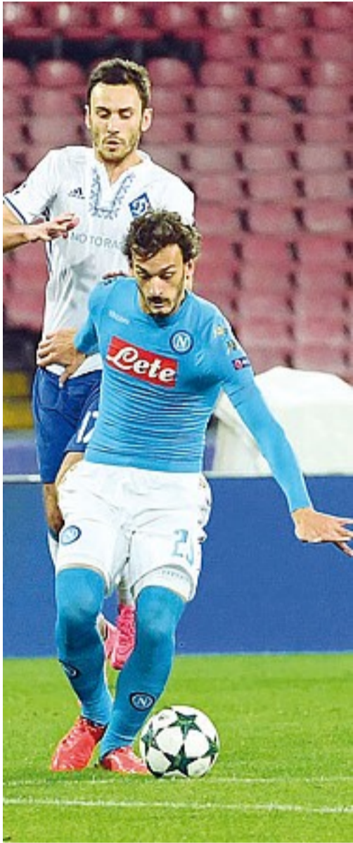
Offerta Gabbiadini in uscita, lo vuole il Southampton

Ha sciolto le riserve anche Patrice Evra, che dopo essere stato accostato al Valencia, al Crystal Palace e allo United, ora approda alla corte di Rudi Garcia al Marsiglia. Firmerà