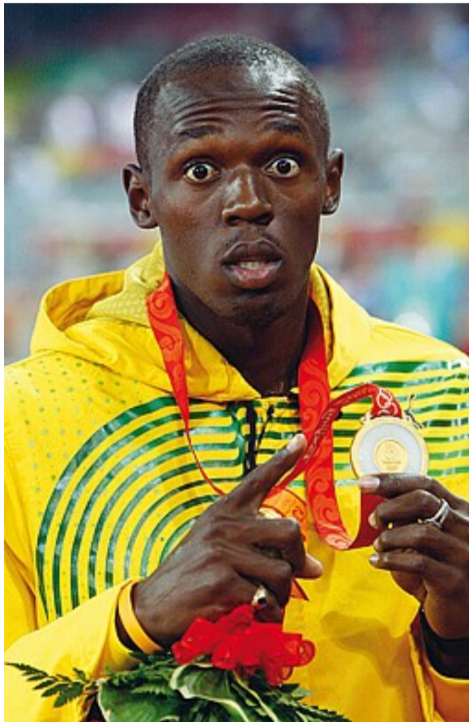
C'era una volta Bolt con uno degli ori di Pechino e nella staffetta incrinata

Se la legge è uguale per tutti (Bolt, però, non è uguale a nessun altro), va bene così. Alla fine di un iter cominciato il 3 giugno 2016, quando la positività alla metilexaneamina venne alla luce, il giamaicano Carter — che appartiene alla parrocchia di Stephen Francis e non a quella di Glen Mills, da sempre allenatore del Lampo — rimane triturato negli ingranaggi della riapertura delle provette, sull'onda della voglia pazza di pulizia con cui il Cio sta facendo ordine tra gli scheletri negli armadi. L'oro della staffetta (con record) era stato la ciliegina sulla fantastica tripla (100, 200, 4x100) con cui il fenomeno di Trelawny, Giamaica, si era presentato agli dei di Olimpia in Cina, quando nessuno — nemmeno Bolt — poteva azzardare di essere in grado di dominare i Giochi at-