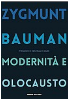
Il libro in edicola da domani

Si è comparso lo scorso 9 gennaio all’età di 91 anni, il sociologo Zygmunt Bauman è stato uno dei critici più acuti del mondo in cui viviamo. Riproporre le sue riflessioni sulla Shoah è il modo migliore per presentarsi all’appuntamento con il Giorno della Memoria, che commemora l’apertura dei cancelli di Auschwitz, da parte dei soldati sovietici, il 27 gennaio 1945. Perciò il «Corriere della Sera» propone da domani ai suoi lettori, in edicola assieme al quotidiano per un mese, il saggio di Bauman Modernità e Olocausto al prezzo di € 8,90 più il prezzo del giornale. Questo libro uscito in edizione originale nel 1989 (e pubblicato in Italia dal Mulino nel 1992) segnò una netta svolta interpretativa, come sottolinea