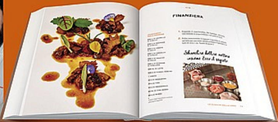
FOTO E PREPARAZIONI CON LO CHEF E LA SUA SQUADRA • LA SCUOLA DI CUCINA • 40 RICETTE • I CONSIGLI DELLO CHEF

L'alta cucina di Antonino Cannavacciuolo arriva sulla tua tavola grazie a un'esclusiva collana di ricettari. Con ingredienti semplici, passione e i consigli dello chef tutto sarà più facile: tante ricette spiegate e fotografate in ogni passaggio, oltre a una ricca sezione di scuola di cucina dedicata a tecniche di base, piccoli trucchi e tanto altro. Fidati di Antonino!