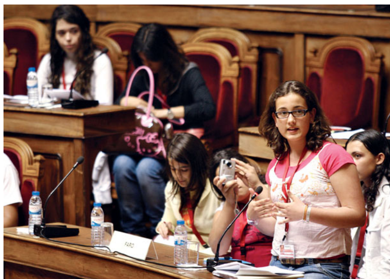
Ensino, transportes e ambiente são alguns dos temas que serão debatidos

A Assembleia Municipal de Lisboa (AML) discute hoje a proposta do partido Os Verdes que pretende criar uma Assembleia Municipal de «Jovens dos segundo e terceiro ciclos e do Ensino Secundário» para discutirem as suas «necessidades, expetativas e aspirações» em áreas tão diversas como o desporto, a cultura, o espaço público, os transportes, o ensino e o ambiente.