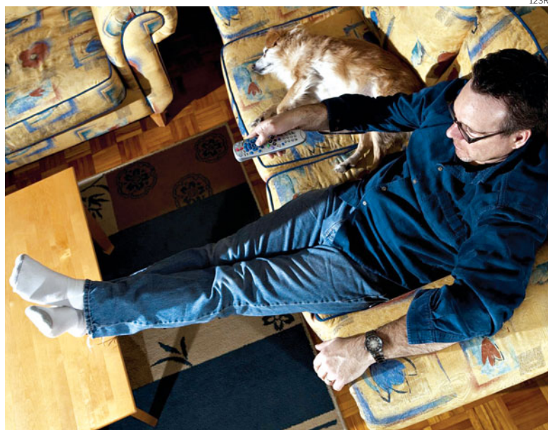
Contratos mais caros e custos de instalação elevados resultam da nova lei

A este entrave à liberdade de escolha, juntam-se outros. Como os custos