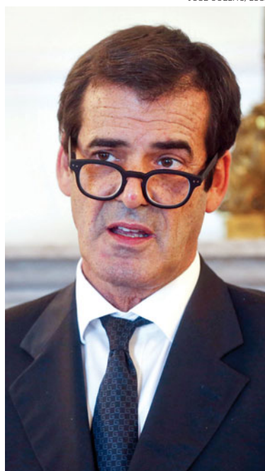
Autarca vai pedir um «parecer do Conselho Municipal de Economia»