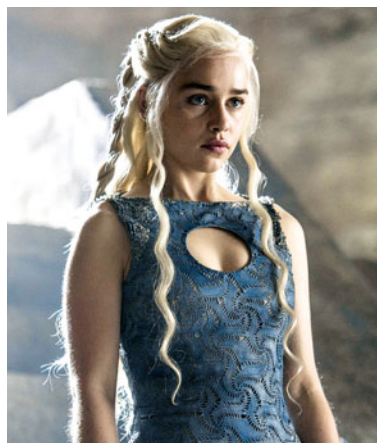
Emilia Clarke (28 anos) "tem" 16 anos na série 'A Guerra dos Tronos'

O estado da Califórnia acaba de aprovar uma lei que permite aos artistas solicitar que se elimine da Internet informação relacionada com a sua data de nascimento. A medida visa lutar contra a discriminação sentida na indústria da Sétima Arte no que à idade diz respeito.