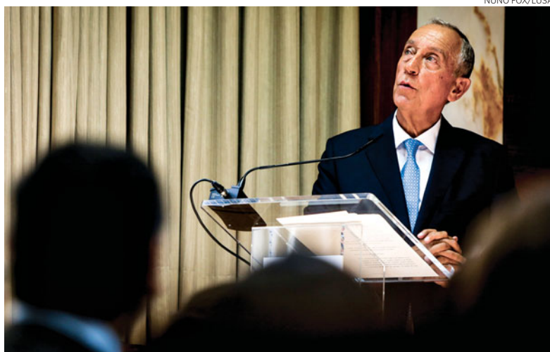
O Presidente da República defende um mínimo de estabilidade