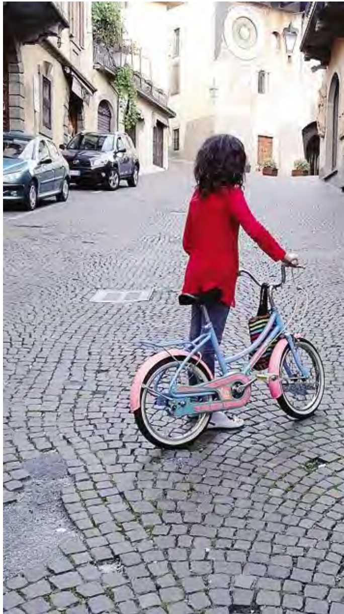
La strada che porta alla torre dell'Orologio è rappezzata

Non si tratterà però di un solo intervento di sostituzione. «Abbiamo intenzione – continua Trussardi – di contattare tutte le società che si occupano di utenze e chiedere