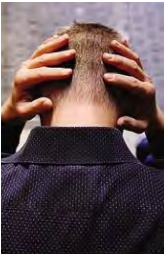
Un mese di iniziative in valle

È in occasione della Giornata mondiale della salute mentale, indetta dall'Onu ogni 10 ottobre, che il «Tavolo salute mentale» della Valle Brembana vuole rinnovare il suo impegno a favore dei disagi mentali scegliendo ottobre come il «Mese della salute mentale». L'iniziativa, promossa dalle organizzazioni della Valle che si occupano quotidianamente di salute mentale, di percorsi di cura e dell'integrazione sociale e lavorativa dei malati, ha l'obiettivo di sensibilizzare, informare e raccontare storie, problemi e risorse di chi sperimenta una sofferenza psichica. A dare il via al «Mese della salute mentale» un'apericena con balli e canti, venerdì, alle 18, al centro sportivo «Al Campus» di Serina. Seguiranno numerosissimi appuntamenti di carattere artistico e culturale, di notevole interesse tanto per le tematiche affrontate quanto per i diversi linguaggi comunicativi utilizzati. Dal cineforum (il 12 ottobre alle 20,30 a Valpiana di Serina) al cinema, con la proiezione del film «Abbraccio per me» (il 14 alle 20,45 a Zogno); dal