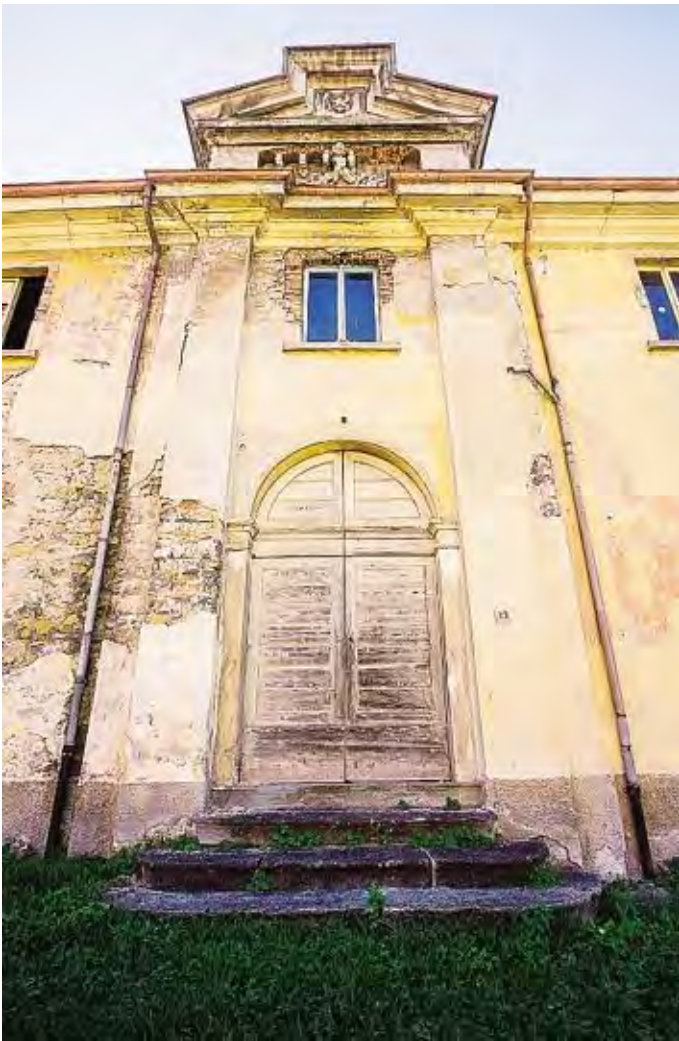
L'ex poligono della Marina militare, oggi in stato di abbandono ROTA

Si parte con il recupero, poi il museo sarà da costruire.