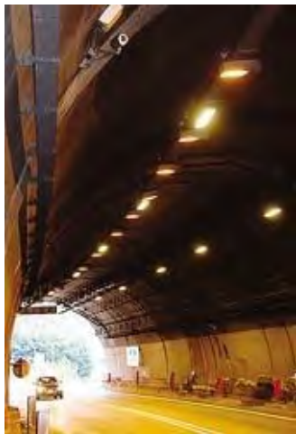
La galleria Lovere sulla statale 42

Nella sua lunga lettera, il lettore (di Pianico, insegnante di matematica) mette in evidenza l'importanza strategica della galleria che bypassando il centro abitato di Lovere ha abbattuto i tempi di percorrenza e di attraversamento dell'Alto Sebino. «Quando la galleria è chiusa, come accaduto pochi anni fa per puntellare la volta del tunnel su cui si era formata una lunga e larga crepa, per andare da Rogno a Endine Gaiano distanti appena 15 chilometri i camion dove-