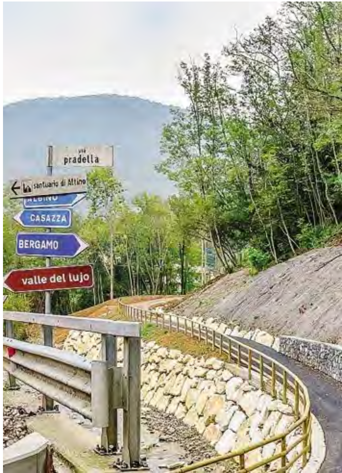
La ciclabile della Valle del Lupo, uno dei cantieri finiti sotto la lente