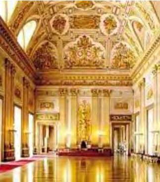
Un salone della Reggia di Caserta

I grandi saloni, i magnifici giardini, l'acquedotto prodigio dell'ingegneria idraulica, la fabbrica di seta di San Leucio, con il suo esperimento quasi «socialista» di organizzazione sociale: riparte dalla reggia di Caserta (dal 10 ottobre alle 21,40 su Rai Storia) «Italia: viaggio nella bellezza», realizzata in collaborazione con il Mibact.