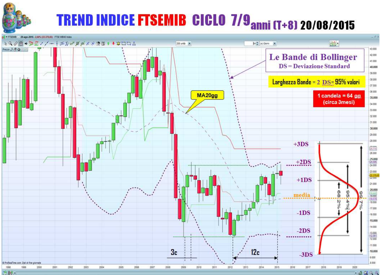
Figura 2: Bande di Bollinger del ciclo T+8 in trend laterale

Le Bande di Bollinger sono come una autostrada sulla quale si muovono i prezzi .... come possiamo continuare a salire o a sperare in un mercato toro con le Bande di Bollinger in trend laterale ? . ..... se una candela corrisponde ad un periodo di 3 mesi di mercato, questo significa che nei prossimi 3 mesi i prezzi o si muovono in trend laterale o scendono.