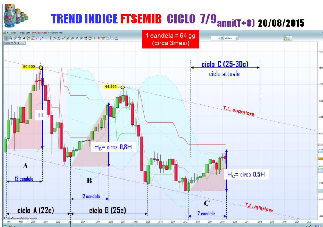
Figura 1: Ciclo T+8 del FtseMib