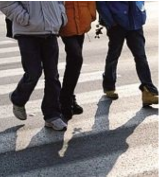
#MaiPiùBullismo su Rai 2