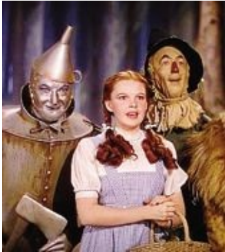
Judy Garland ne «Il mago di Oz»

Da domenica sarà nelle sale «Il mago di Oz» (1939) in edizione restaurata. Presentato dalla Cineteca di Bologna nell'ambito del progetto «Il cinema ritrova- to. Al cinema», è scolpito nella memoria con una canzone, «Over the Rainbow», che, dopo Judy Garland, avrebbero canta- to in molti.