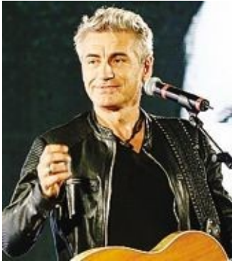
Luciano Ligabue

Luciano Ligabue ha in cantiere, ormai è chiaro, anche un film: «Cisto pensando, per 14 anni ho avuto la scusa di non avere una storia da film. Siccome la storia c'è...». Come quei provini in un cassetto di casa che raccontano «con un genere diversissimo dal mio, una serie di personaggi tutti nati il 29 febbraio».