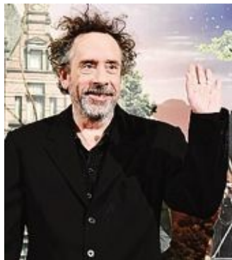
Il regista Tim Burton

È arrivato ieri sera a Roma Tim Burton, per presentare al pubblico italiano il suo ultimo film «Miss Peregrine - La casa dei ragazzi speciali», tratto dall'omonimo romanzo di Ransom Riggs. «Credo che nella vita bastino un paio di persone che riescano a vedere e incoraggiare le tue doti per consentirti di farle fiorire».