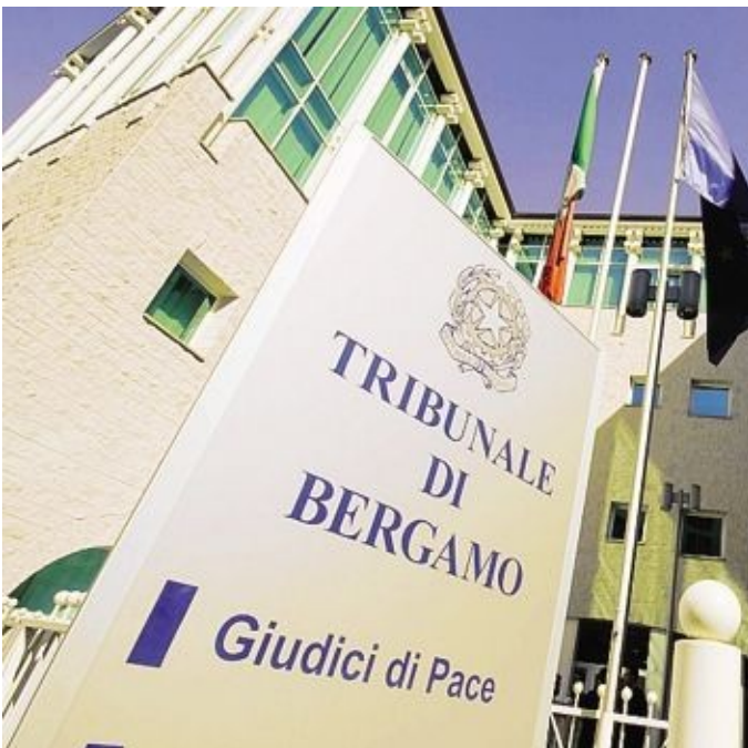
Ieri mattina l'udienza al Tribunale di Bergamo

Il 32enne maghrebino, che parla di 4 giovani, ha raccontato di aver risposto che non fumava e che quindi non aveva con sé sigarette. C.S. a processo ha invece raccontato che F.M. aveva chiesto una sigaretta perché il giovane nordafricano stava fumando. Quest'ultimo, sempre secondo il racconto che ha fatto C.S. in aula, avrebbe risposto sgarbatamente: «B... tornate a casa, cosa