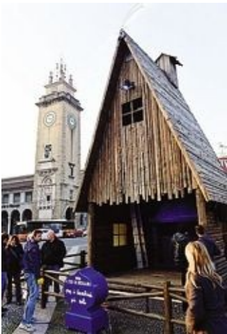
La capanna de L'Eco BEDOLIS