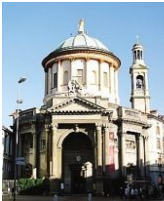
La chiesa delle Grazie

Pio IX l'8 dicembre 1854 (Bolla «Ineffabilis Deus»), la definizione dogmatica dell'Immacolata Concezione della Beata Vergine Maria afferma l'esenzione di Maria dal peccato originale fin dal momento del suo concepimento nel grembo materno. Il dogma mariano coronava una verità di fede da sempre creduta dal popolo cristiano, ma anche dibattiti teologici secolari. La definizione dogmatica del 1854 ebbe vastissima eco nella nostra diocesi e fu