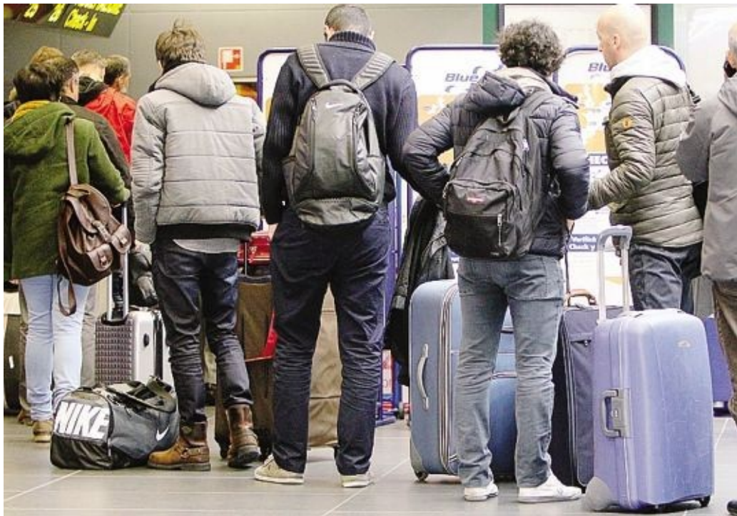
In coda per il check-in: dicembre a Orio è tutto esaurito

Vacanze brevi, non sempre low cost Non temono il freddo, invece, i bergamaschi (e sono tanti) che, per il ponte hanno scelto le località più rinomate per gli intramontabili mercatini natalizi. Un merca-