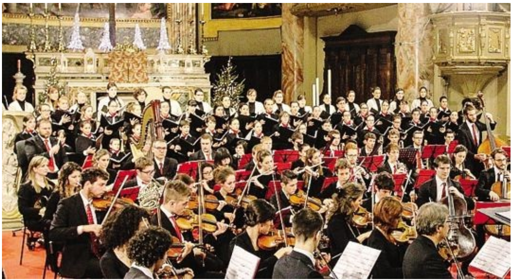
Una delle precedenti edizioni del concerto

Il concerto – che sarà trasmesso sugli schermi di Bergamo Tv prima della Messa di mezzanotte di Natale in Cattedrale – è su invito: chi fosse in-