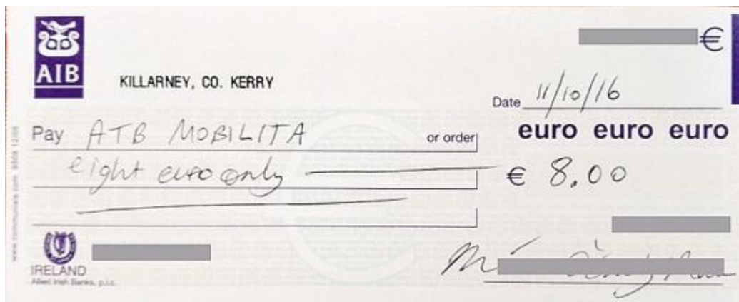
L'assegno di otto euro inviato ad Atb Mobilità dal turista irlandese

Il bigliettino arriva da Killarney, vivace cittadina del Kerry. Poche righe in inglese, in cui si spiega di voler rimediare. Si parla di «fine», multa, ma in realtà si tratta di quattro ore di sosta non pagate, conto totale otto euro. La busta con l'assegno è stata recapitata agli uffici Atb, dove ieri è stata aperta con non poco stupore.