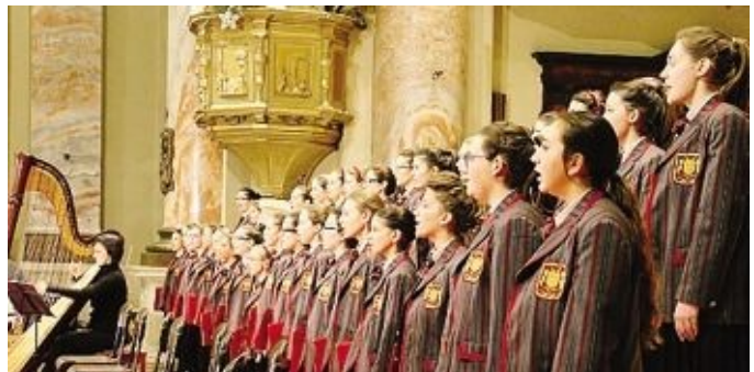
L'ensemble femminile dei Piccoli Musici