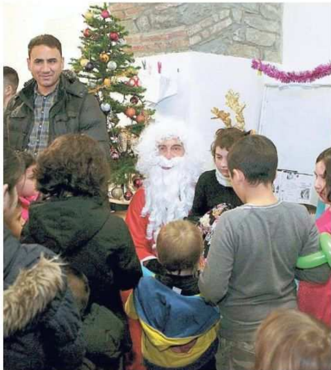
Babbo Natale con i bambini dei richiedenti asilo in via Bonomo

L'iniziativa che ha anticipato di una settimana il Natale è stata organizzata dall'Ics e da «Aiutiamoci ad aiutare Trieste», un gruppo nato su Facebook per mettere in piedi azioni solidali di natura informale in favore di persone e di intere famiglie che stanno attraversando un momento di difficoltà. Le due realtà hanno deciso di avvicinarsi in questa maniera al 25 dicembre, ritrovandosi attorno all'albero illuminato e scambiandosi i doni in un clima colorato e multietnico. Bambini italiani, figli degli operatori dell'Ics e degli altri volontari presenti, hanno coinciso nei giochi e nei balli i bambini ospiti delle diverse strutture che a Trieste accolgono i richiedenti asilo. «Ho ricevuto una collanina con un ciوندolo a