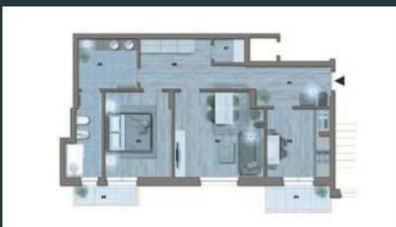
Appartamenti di 71mq - a partire da 108.000€ APE: F 121,39 kWh/mq