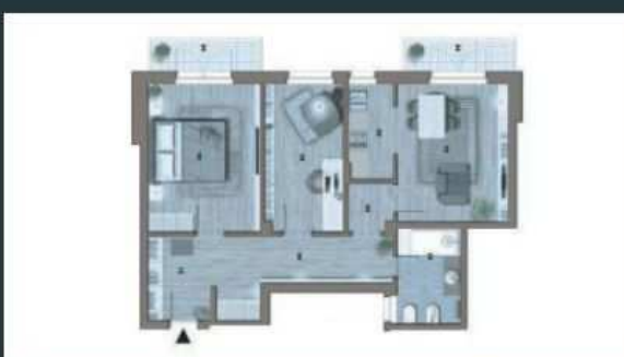
Appartamenti di 63mq - a partire da 113.000€ APE: G 157,45 kWh/mq