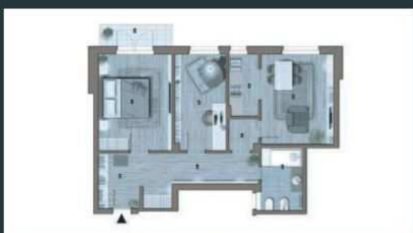
Appartamento di 63mq - 111.000€ APE: F 147,97 kWh/mq