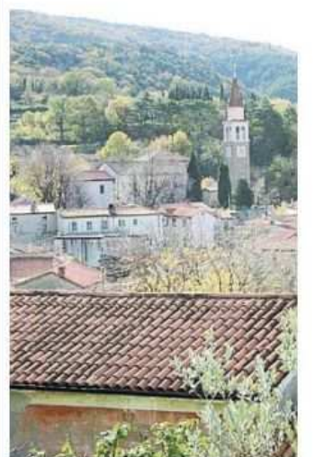
Scorcio di San Dorligo della Valle