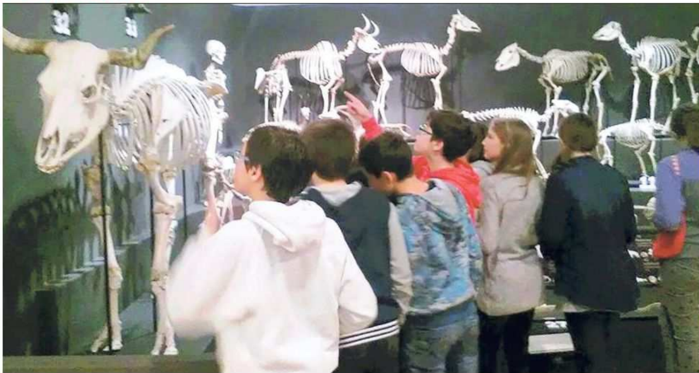
Alcuni ragazzi in visita al Museo di Storia naturale di via Tominz: stanno per partire quattro campus natalizi pensati apposta per loro