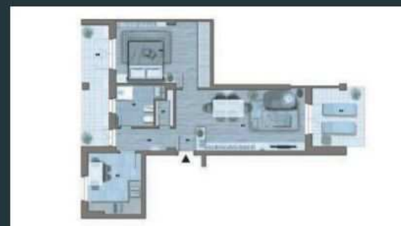
Appartamenti di 70mq - a partire da 109.500€ APE: F 129,92 kWh/mq