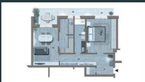
Appartamenti di 67mq - a partire da 106.500€ APE: F 131,09 kWh/mq

Si fa presente che la proprietà ha intenzione di svolgere alcuni lavori di miglioria nelle parti comuni dell'immobile il cui costo verrà interamente sostenuto dalla stessa.