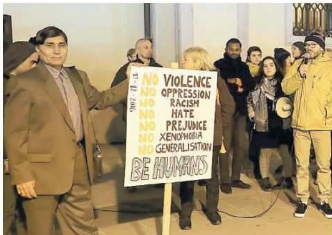
La manifestazione in campo San Giacomo

L'assemblea pubblica è stata un'occasione per i cittadini interessati a confrontarsi su questi temi: molti manifestanti hanno preso la parola. Sono state so-