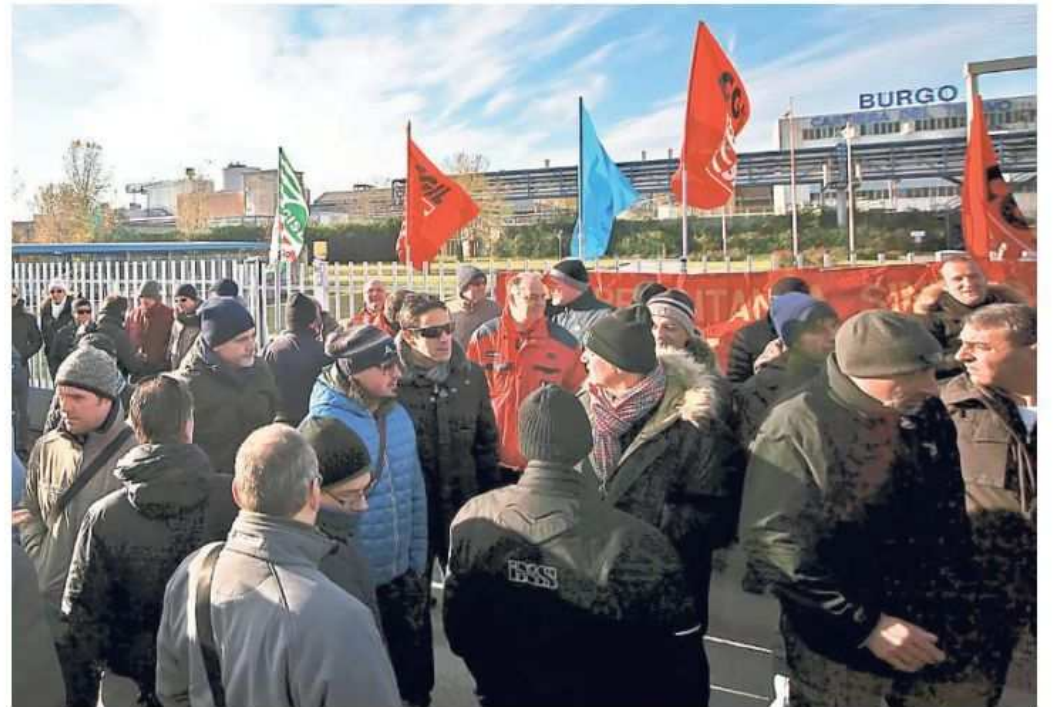
Presidio davanti alla sede della cartiera Burgo di San Giovanni di Duino

dotto da quantificare, comunque significativo. Senza dimenticare - proseguono - che la diversificazione del prodotto metterebbe strutturalmente in sicurezza lo stabilimento nella sua economicità e in buona parte nei suoi livelli occupazionali. La linea riconvertita - continuano i tre sindacalisti - produrrebbe circa 30mila tonnellate all'anno di fanghi di lavorazione, pari a circa 82 tonnellate al giorno, che potrebbero essere