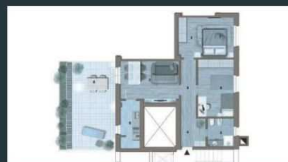
Appartamento di 84mq - 157.500€ APE: G 337,36 kWh/mq