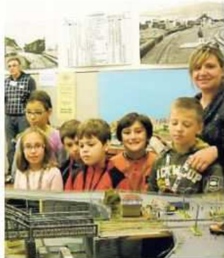
Sopra, alcuni bimbi al Ferclub mentre osservano i trenini nella sede di Servola. A sinistra, nella foto centrale, il complesso bandistico Arcobaleno

effetti speciali, i due Plastici Märklin, il rinnovato Plastico delle Ferrovie Retiche in scala H0m, il Plastico in scala N (1/160), tutti dotati di effetti speciali di ogni tipo. Uno spazio speciale è riservato ai bambini ai cui il Ferclub riserva un plastico ferroviario tutto per loro su cui potranno manovrare vari treni, partecipando al sorteggio di omaggi ferroviari alle 12.