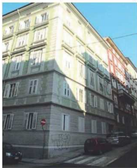
TRIBUNALE DI TRIESTE ESECUZIONE IMMOBILIARE R.G.E. 177/15