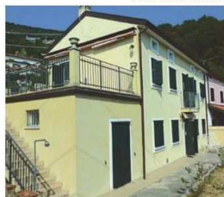
TRIBUNALE ORDINARIO DI TRIESTE ESECUZIONE IMMOBILIARE R.E. 49/2016