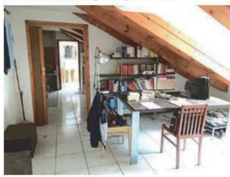
TRIBUNALE DI TRIESTE ESECUZIONE IMMOBILIARE R.G.E. 102/14

Professionista delegato alle operazioni di vendita e custode: Avv. Francesco PELLEGRINI, con studio in Trieste, Via Carpi n. 10, ove si terrà la vendita (tel./fax 040.3728060, e-mail: avv.francesco.pellegrini@gmail.com).