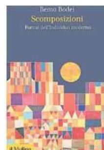
"Scomposizioni" di Remo Bodei (Il Mulino)