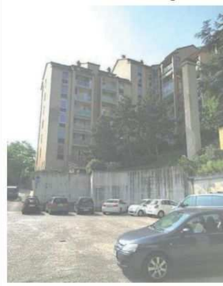
TRIBUNALE DI TRIESTE ESECUZIONE IMMOBILIARE R.E. N° 103/2016