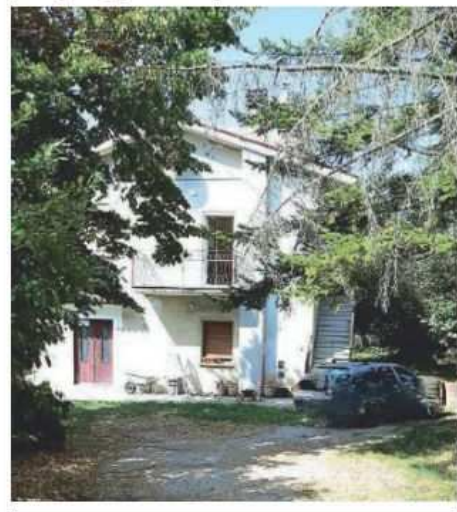
ESECUZIONE IMMOBILIARE R.E. 91/2016