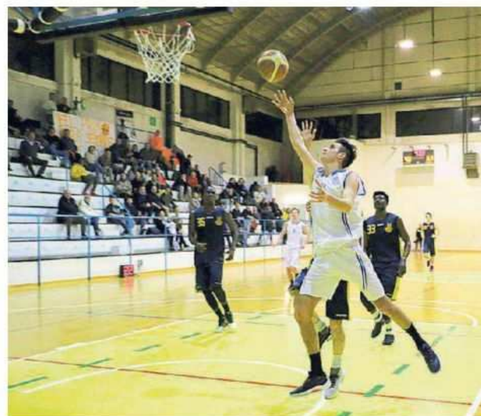
Il Breg non si ferma più. Neanche Spilimbergo ha saputo frenarla