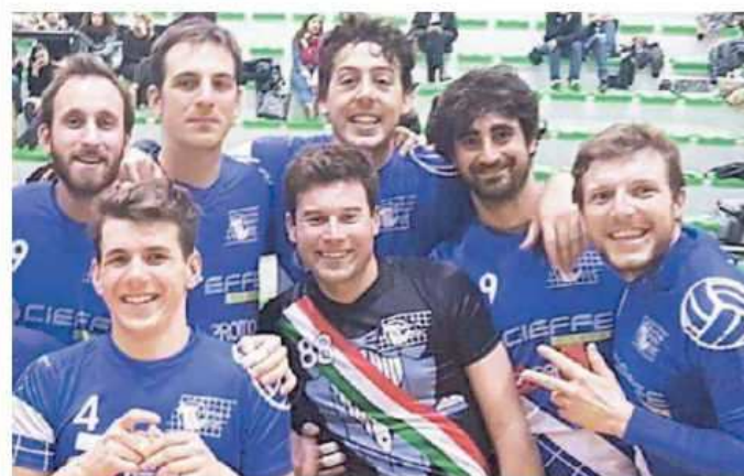
Foto di gruppo di alcuni dei giocatori della Triestina Volley Cieffe