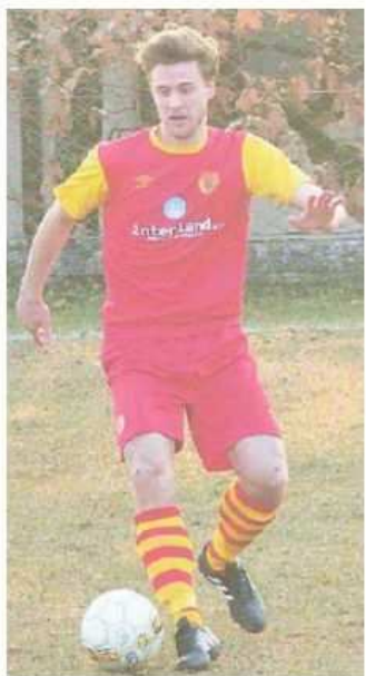
Primorje in una foto d'archivio

Calendario “ballerino”, il Primorje salta