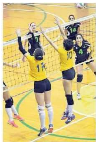
La partita tra Cus e Vitalfrutta