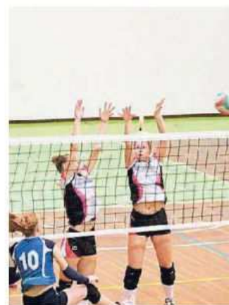
Il muro compatto della Virtus