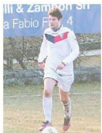
Un giocatore del Mladost