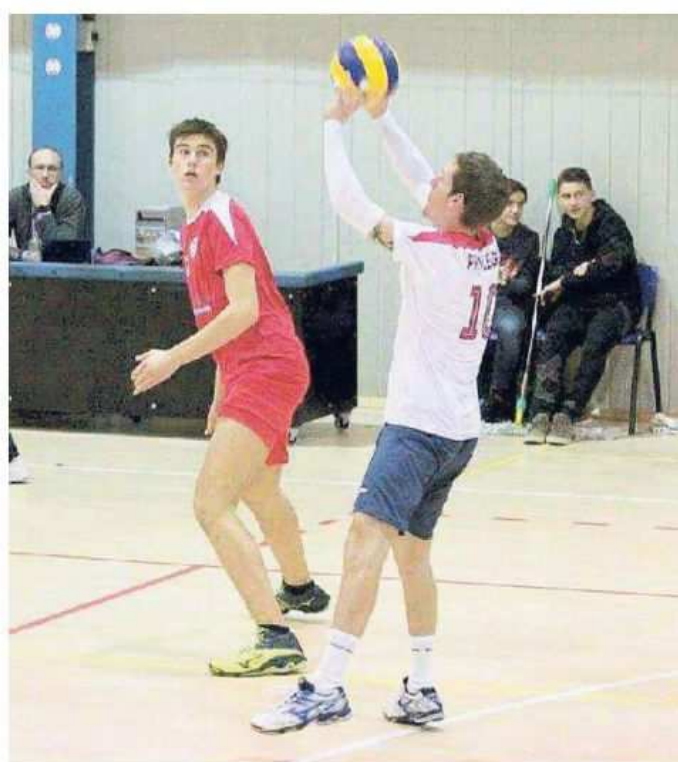
Azione difensiva per i biancorossi del Televita sloga Tabor

Un vero peccato, perché nella giornata favorevole come risultati, nella quale le dirette rivali affondano, il Televita non riesce a tirarsi su dalle onde impetuose della lotta per la permanenza in categoria. Va-