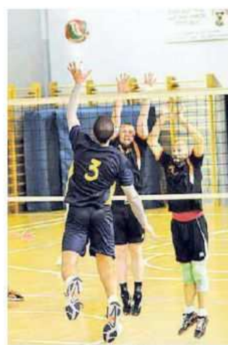
L'attacco dei gialloblù del Cus