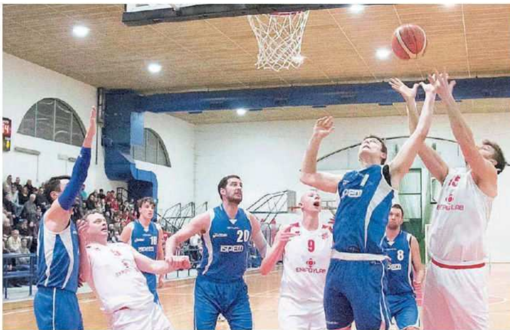
Lotta senza esclusione di colpi sottocanestro nel derby di Monfalcone.

Monfalconesi che avevano iniziato bene la partita (4-0 con un Benigni old style in difesa) tanto da far chiamare un time-out immediato a coach Oberdan che ha voluto dare subito la sveglia ai suoi, riuscendo-