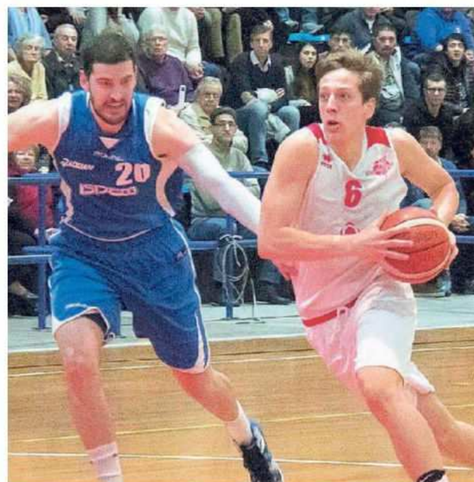
Un'azione d'attacco della Falconstar

10 punti e la presenza a rimbalzo - soprattutto se pensiamo alla gara di andata (+19 Jadran, ndr) siamo cresciuti molto e anche in questa gara siamo rimasti sempre in scia. Ovvio che quando passi un'intera gara all'inseguimento negli ultimi minuti perdi in lucidità e lo Jadran è stato più lucido di noi alla fine. Ci hanno concessi pochi tiri aperti e puniti tutti i nostri errori, ma del resto sapevamo di avere di fronte una squadra tosta. Abbiamo perso in volata con la terza in classifica, vuol dire che il nostro livello è buono. Ora dobbiamo concentrarci sulle ultime 5 gare, per noi sarà fondamentale non sbagliare più in casa». (m.n.)