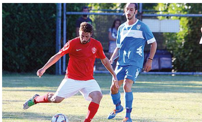
Un momento dell'amichevole della Triestina contro il Vesna

Nel pomeriggio, alle 18.30, l'amichevole in via Felluga prima di tre giorni di riposo concessi per Ferragosto