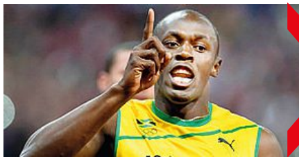
Il velocista giamaicano Usain Bolt