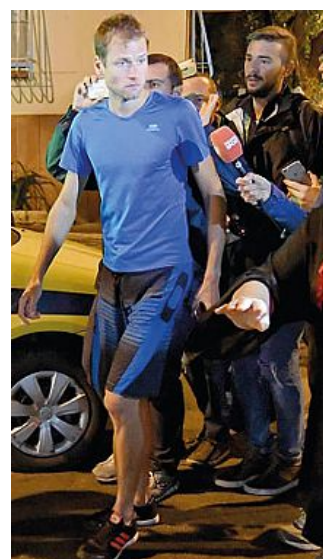
Schwazer ha lasciato Rio

L'ultima notte brasiliana di Alex Schwazer , braccato dai giornalisti, in cerca di pace dopo la squalifica per otto anni. «Non mi sembrava che l'udienza fosse poi andata così male, direi meglio del previsto, per questo ho voluto cercarci fino alla fine. Di quelle 10 ore non è rimasto nulla, solo una grande amarezza. Credevo di poter partecipare alle Olimpiadi, è da oltre un anno che lavoro con tanti sacrifici anche economici», ci ha detto il marciatore azzurro.