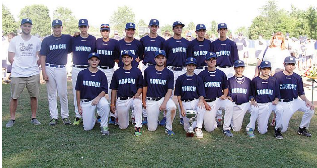
La formazione Cadetti sarà impegnata a settembre alle finali nazionali di categoria

L'impianto di piazzale Atleti Azzurri d'Italia che, nel passato, ha ospitato manifestazioni di rilievo come la qualificazione olimpica nel 2007, vedrà impegnate ben nove formazioni provenienti da tutt'Europa. Anche in questo caso si tratterà del top del softball del vecchio continente. A rappresentare l'Italia saranno Bussolengo e Forlì, due formazioni pluridecorate e dalle quali ci si attende davvero molto in questa competizione. Con loro, ai nastri di partenza troveremo anche Joudrs (Repubblica Ceca), Les Comanches (Francia), Eagles (Svizzera), Skovde (Svezia), Sparks (Olanda), Vermens (Germania) e