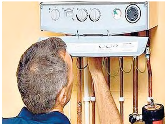
Un addetto controlla il funzionamento di una caldaia

Alcuni istituti comunali hanno avuto problemi con l'accensione anticipata Le maestre sono corse ai ripari facendo indossare maglioni ai piccoli