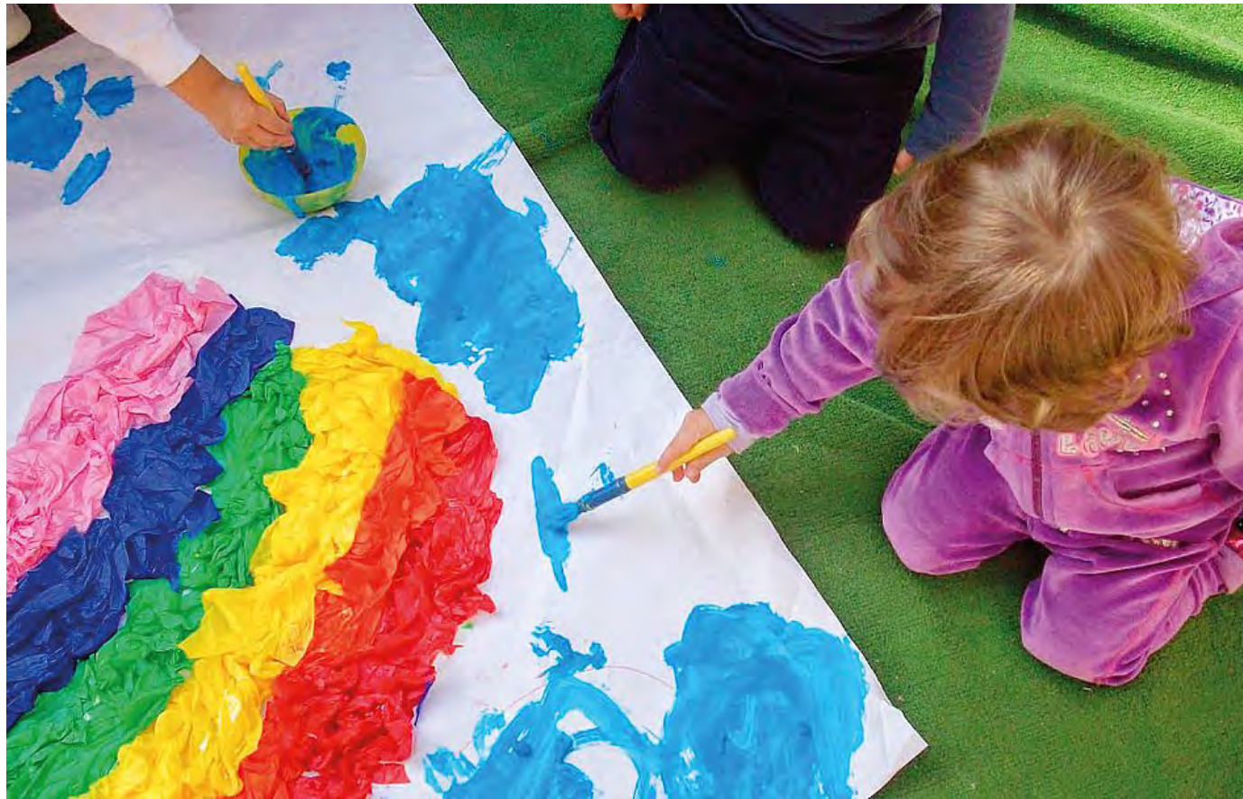
Bambini giocano all'interno di un asilo