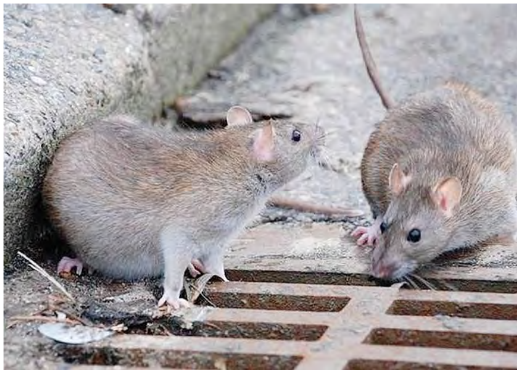
Topi sulla grata di un tombino in mezzo ad una strada

sioni sull'argomento scoppiate nei mesi scorsi, una ragazza scrive di aver contato a Campi Elisi una novantina di topi, avvistati dal balcone della sua casa in via Tonello. Oltre 150 quelli che afferma di aver visto invece un altro cittadino nella zona dello Stadio. E altri sono spuntati poi in piazzale della Resistenza, piazza Libertà, in zona Universi-