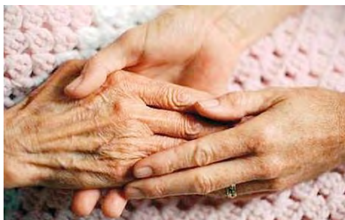
L'associazione de Banfield vuole aiutare anche chi si prende cura dei malati

L'associazione de Banfield trasforma la vecchia sede in un luogo di accoglienza per familiari e parenti