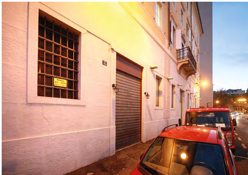
La serranda chiusa dell'ex Trattoria da Mario

La decisione di chiudere, peraltro, non ha niente a che