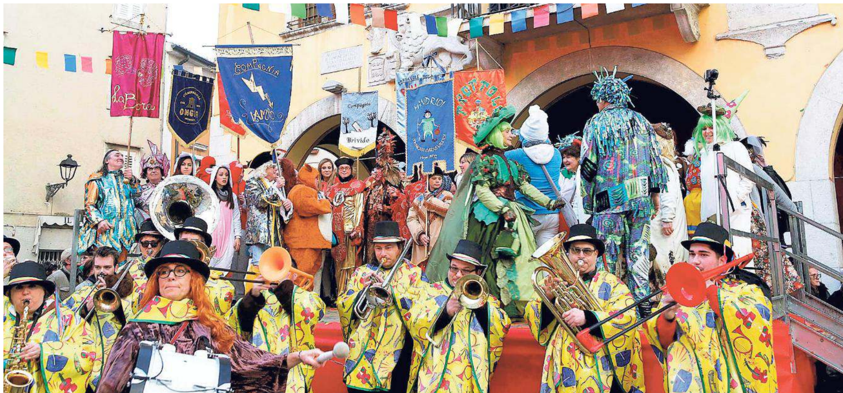
Un'immagine della giornata inaugurale dello scorso Carnevale invernale di Muggia