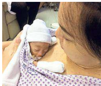
Un'altra “mamma canguro”

Al Miela congresso dedicato alle incubatrici naturali cui partecipano duecento esperti di 38 paesi. La terapia esordì in Colombia negli anni '70