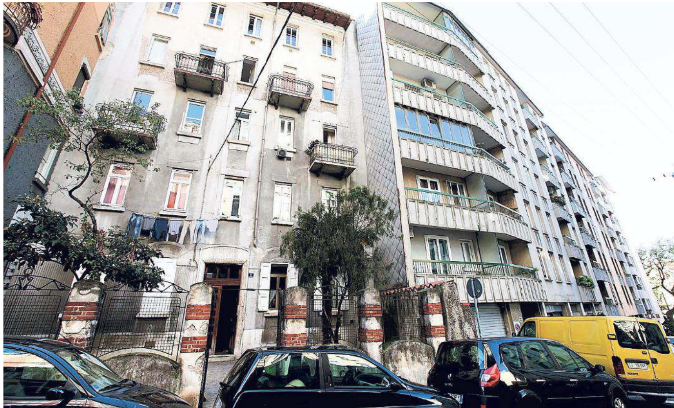
Lo stabile di via Revoltella in cui si è verificato l'incendio. Non è esclusa alcuna ipotesi, neanche quella di un'azione deliberata

«Nel corso del tempo - ancora - siamo stati testimoni di violenti litigi e vittime di vandalismi. Abbiamo visto file di ragazzi e ragazze, alcuni dei quali decisamente minorenni, essere ricevuti da Rocco ad ogni