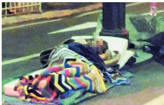
Un senzatetto all'ingresso di Porto vecchio

Presentato dall'assessore Grilli il piano "Emergenza freddo" con trentacinque posti letto disponibili