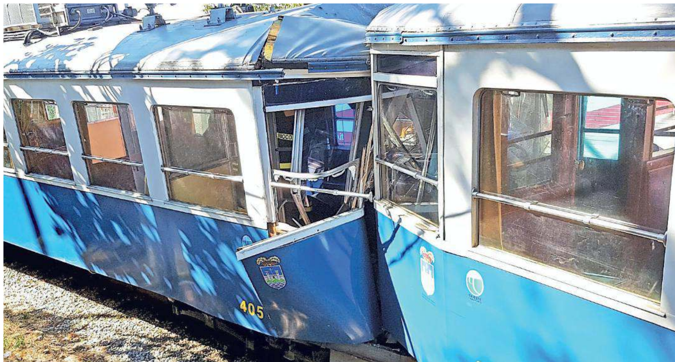
Il drammatico scontro del 16 agosto, in cui rimasero feriti il manovratore e otto passeggeri