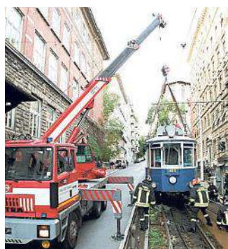
Alcuni dei tanti incidenti accaduti al tram di Opicina. A sinistra e sopra due deragliamenti, rispettivamente nel 2012 e nel lontano 2000