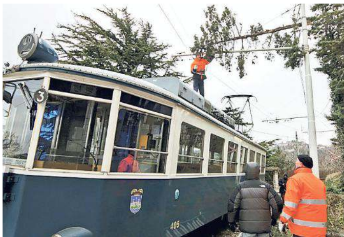
Anche la bora ci si è messa, nel 2010, per fermare il tram (a sinistra), facendo cadere un albero sui cavi delle rete elettrica. Diversi anche gli incidenti con le auto