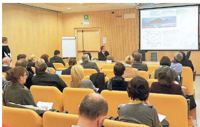
L'incontro bilaterale ospitato in Area Science Park

Incontro bilaterale in Area. Una ventina i progetti trasfrontalieri già avviati, altri 50 in attesa di fondi Ue