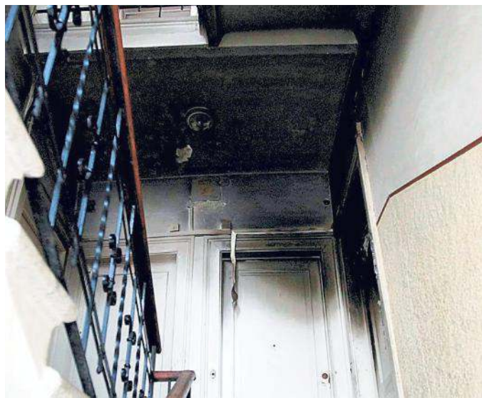
I danni nel vano scale causati dall'incendio dell'altra notte (Silvano)

Al Coroneo Stefano Rocco, noto per aver palpeggiato un'avvocatesa in Tribunale Ma i vicini avevano chiesto alle istituzioni di risolvere il suo caso prima dell'incendio