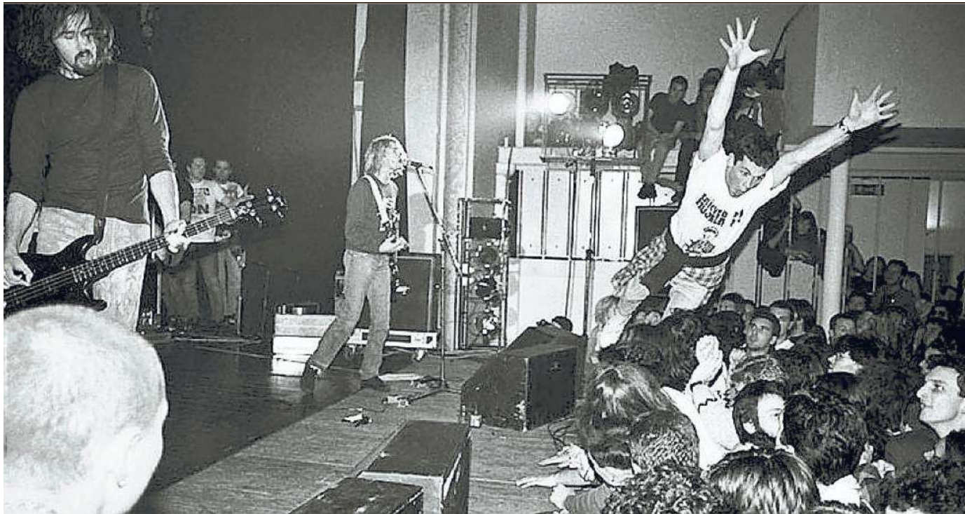
I Nirvana al Teatro Verdi di Muggia il 16 novembre 1991: in alto Kurt Cobain