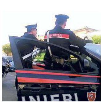
Una pattuglia dei carabinieri

L'uomo è ora ai domiciliari con il divieto di avvicinarsi al proprio congiunto