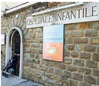
L'ingresso del Burlo

to un primo approccio alla tematica da parte questa volta di circa 90 partecipanti provenienti da 40 Paesi che raccolgono medici, infermieri, ostetrici, psicologi, economisti, pianificatori, funzionari ministeriali, tutti