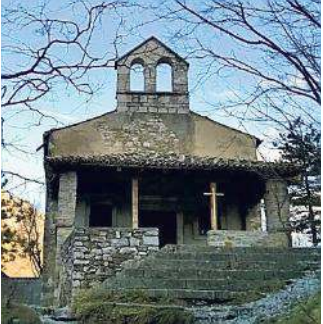
La chiesetta di Santa Maria in Siaris

richiede una specifica esperienza ma in considerazione delle caratteristiche dell’ambiente ipogeo (scarsa visibilità, scivolosità, presenza di acqua e fango) sarà necessario procedere con piede sicuro, facendo attenzione agli appoggi. Inoltre per le dimensioni ridotte di alcuni passaggi si dovrà procedere carponi. Indispensabile l’equipaggiamento speleo individuale. Ritrovo alle 8.30. Informazioni e iscrizione (obbligatoria e a numero chiuso) in via Donota 2 (040369067) dalle 18 alle 20, venerdì fino alle 19.30. Il Gruppo Escursionismo della XXX Ottobre propone invece per questa domenica un’escursione a carattere storico, durante la