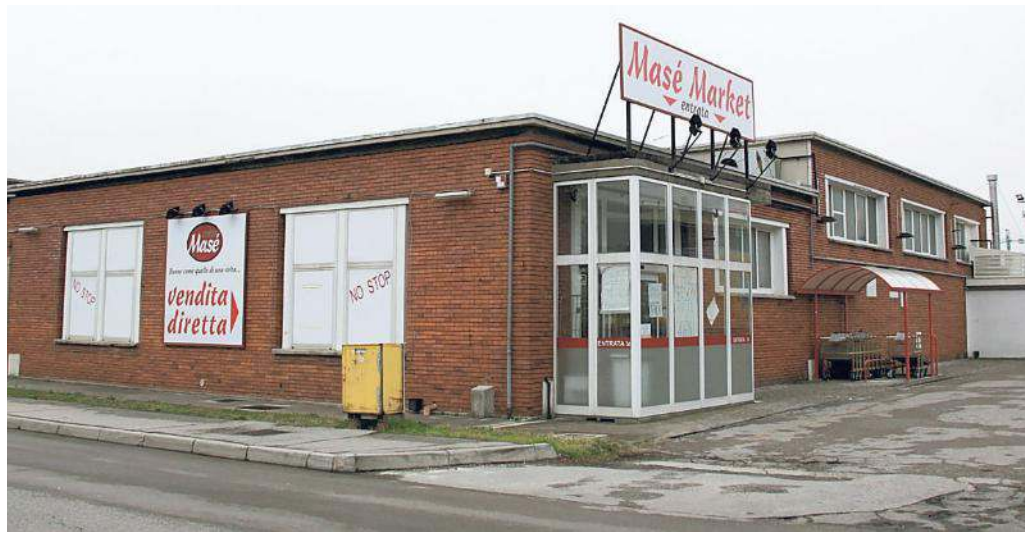
Il Masè Market di San Dorligo della Valle, accanto allo stabilimento di produzione, in una foto di repertorio

Al momento del crac del salumificio Masè - nell'aprile del 2013 - il passivo accertato per l'azienda con 15 punti vendita e 75 dipendenti era stato di oltre 10 milioni di euro. Da qui la richiesta di fallimento in proprio presentata dall'avvocato Umberto Urso a nome proprio del titolare