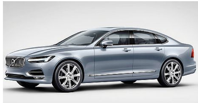
A sinistra e a destra la nuova Volvo V90; sopra la Volvo S90 Blue; sotto gli interni di gusto nordico della V90