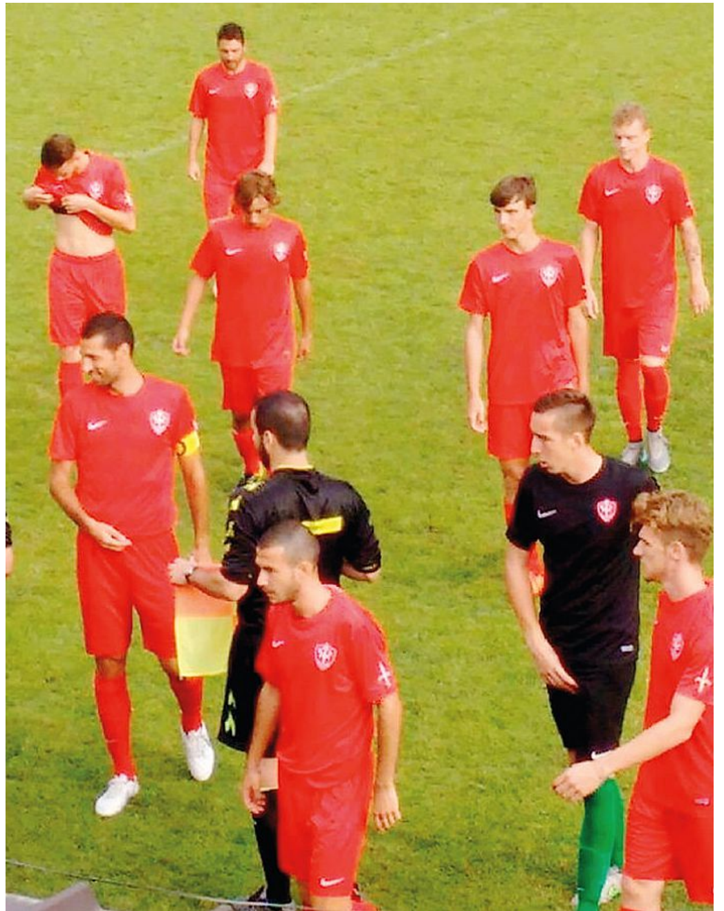
I giocatori rossoalabardati escono dal campo dopo la prima amichevole