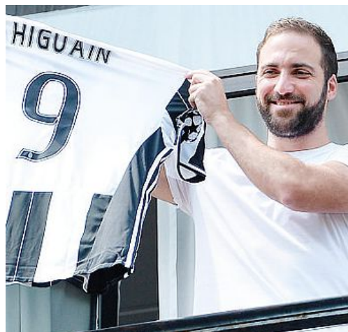
Gonzalo Higuain con la sua nuova maglia

Il mercato Nel giorno dello sbarco a Torino di Gonzalo Higuain non si registrano passi avanti nella trattativa fra la Juventus e il Manchester Utd per Paul Pogba. I 20 milioni di euro di commissione per Mino Raiola continuano a essere un ostacolo alla tanto attesa fumata