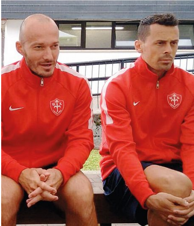
Leonarduzzi e Franca sono rimasti a riposo