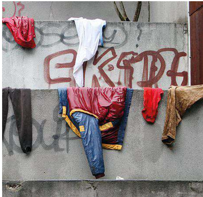
Un bivacco allestito da un gruppo di profughi in via Sant'Anastasio

L'uomo è stato arrestato per violenza sessuale e, dopo gli accertamenti, è stato porta-