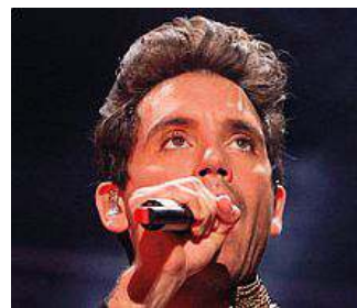
Mika a Trieste

ancor di più sotto) il palco. Striscioni e dichiarazioni d'amore si sprecano. E le giovanissime fan-suo pubblico prevalente -, molte in attesa fin dal mattino anche se i cancelli aprivano alle 19, sono già in estasi. "Grace Kelly" è salutata da un boato. Seguono in scaletta "Good Guys", poi "Staring At The Sun" e "Lollipop". Prima del gran finale in cui è solito proporre "Last Party" e "Love Today". Con successi che hanno invaso radio, lettori mp3 e telefonini di milioni di teenager, ecco a voi Mika. Come in un commercial, se senti il suo pop non puoi smettere di canta-