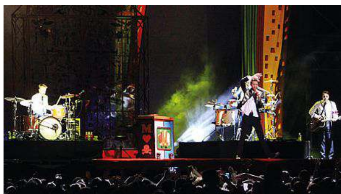
Un momento del concerto. A destra, Mika in azione

Mamme che accompagnano figlie e amiche delle figlie. Alcune accampate per terra già dalla mattina in vari punti attorno a piazza Unità, arrivate dalla regione, dall'intero Paese, dal mondo. «Mamma, dai, non abbiamo tempo, muoviti». La mamma milanese, con shorts e maglietta, stile teenager, e muta, segue quella che ormai è diventato il suo “boss” della giornata, la figlia: Mika non può aspettare. Perché il varco riservato a coloro che hanno prenotato i biglietti da veri fan, quelli del “Golden circle pit”, stava aprendo già alle 16. In una piazza Unità nuovamente blindata già tra le 14 e le 15 per quello che è stato il concerto più pop del cartellone di quest'anno, all'insegna anche della solidarietà, i tre ingressi principali avevano chiuso e confezionato in un con-