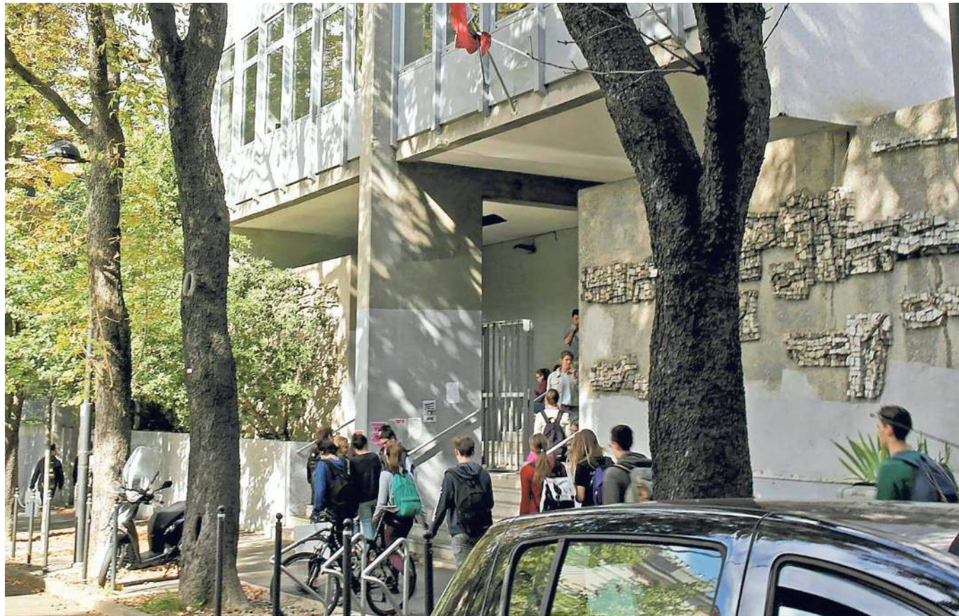
Studenti fuori dall'ingresso della sede centrale del liceo classico Petrarca in via Rossetti