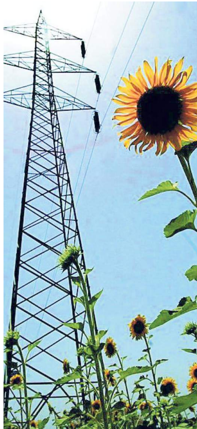
Un traliccio dell'alta tensione in una foto d'archivio