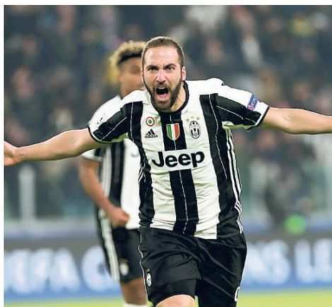
L'esultanza di Higuain dopo il primo gol realizzato alla Dinamo

autore di una pregevole prestazione in difesa coronata dal colpo di testa del 2-0. Il giovane centrale sta crescendo a vista d'occhio e questo non può che rinfancare il tecnico viste le assenze di Bonucci e Barzagli. Infine la Juve ritrova anche Paulo Dybala, mandato in campo nel finale a risultato acquisito per iniziare a mettere