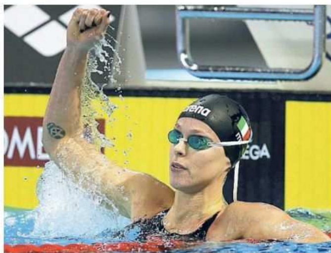
Federica Pellegrini ha festeggiato così il titolo mondiale nei 200 sl

Ma per sbollire la delusione e fare appello a una forza di volontà oramai proverbiale sono bastate poche settimane. Già alla cerimonia di riconsegna del tricolore al Quirinale, Federica Pellegrini apriva al sogno di altri quattro anni, chissà se fino a Tokyo 2020. Intanto, ora arriva un oro Mondiale, in vasca corta. Ma con l'infinita Pellegrini, tutto è possibile.