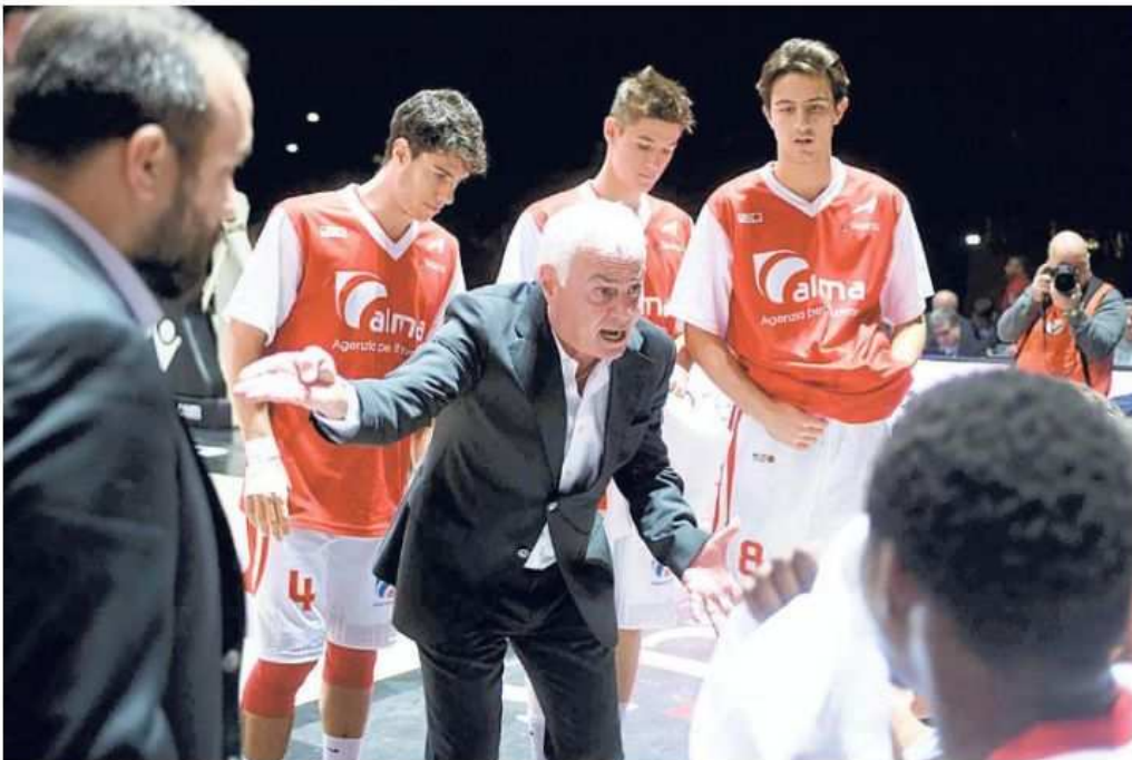
Le indicazioni di Dalmasson durante un timeout. Ma sono rimaste lettera morta

«Mi è stato chiesto più volte, anche in sede di pre-partita; non penso che questo sia un motivo che debba distrarre un gruppo che ha vissuto una grande emozione davanti a settemila persone e che viene da cinque vittorie consecutive. Doveva essere semmai uno sprone aggiuntivo».