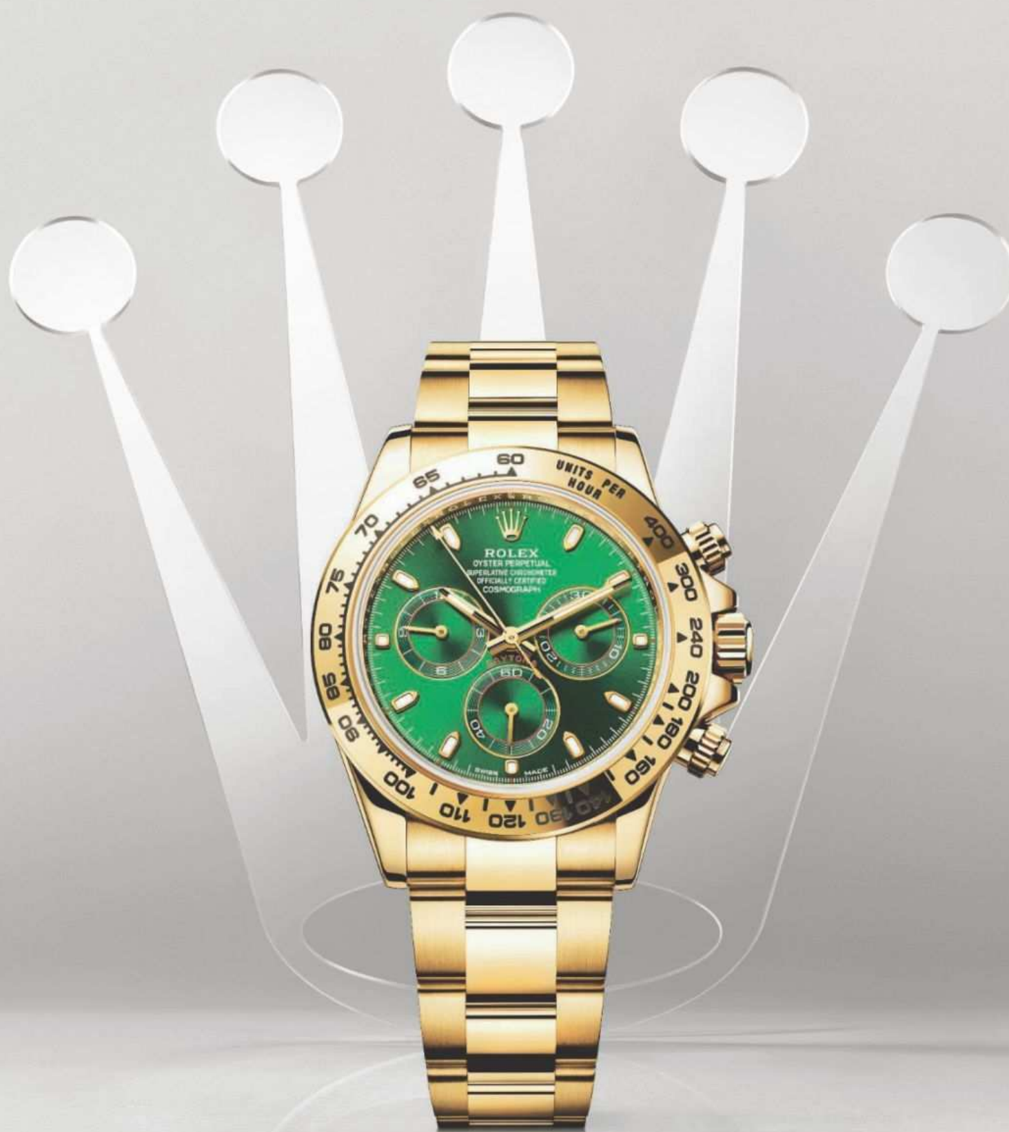
OYSTER PERPETUAL COSMOGRAPH DAYTONA

Un leggendario cronografo creato per la competizione, emblema del legame tra automobilismo ed orologeria. Non segna solo l'ora, segna la storia.