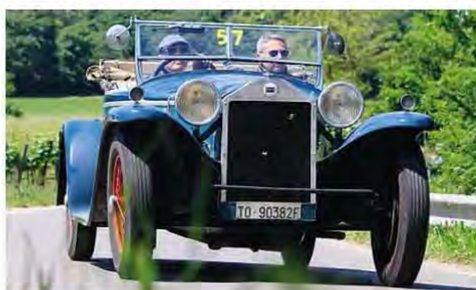
➔ LANCIA LAMBA 6 SERIE CASARO