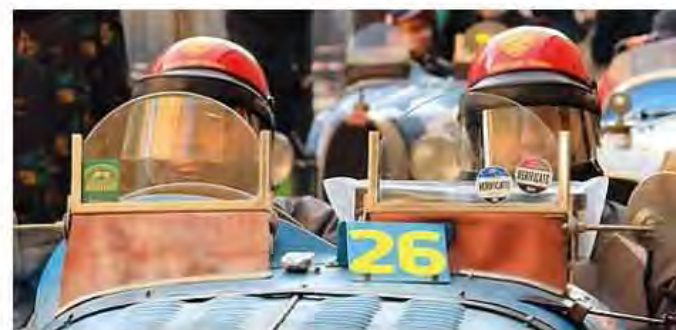
Un particolare della Bugatti T40