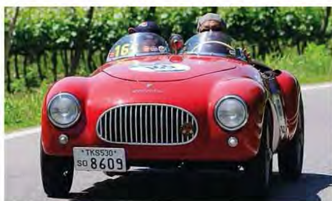
➔ OSCA MT4