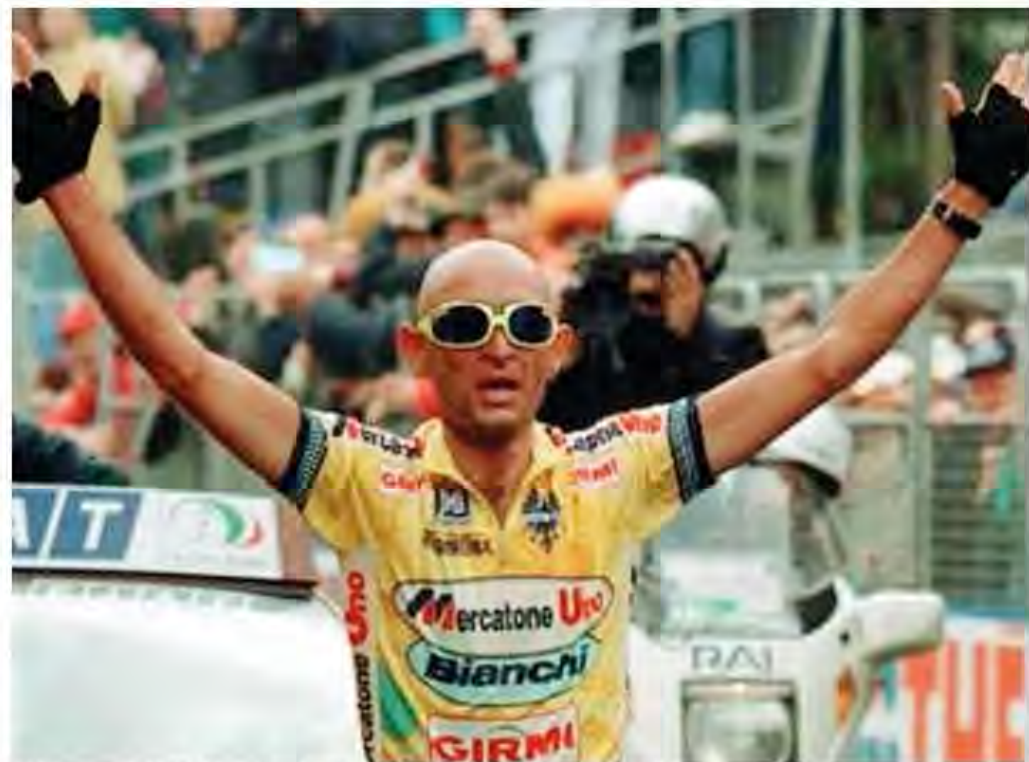
E' il 30 maggio 1998: Marco Pantani taglia da trionfatore il traguardo di Piancavallo

E allora iniziamo proprio dalla fine, dalla settimana che toccherà anche il Friuli Venezia Giulia. Perché quella sarà la settimana delle grandi montagne. Si inizia infatti martedì 23 maggio con la Rovetta-Bormio che dovrebbe includere la cima Coppi del Giro, allo Stelvio. Il giorno dopo, mercoledì 24 maggio, ecco la Tirano-Canazei dal tracciato più ondulato che aspro, per proseguire giovedì 25 maggio con il tappone dolo-