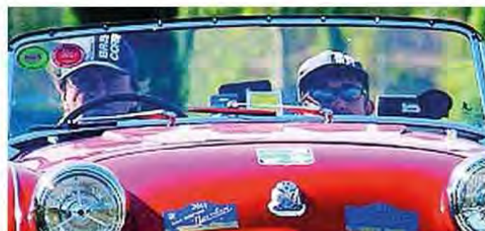
Un particolare della Siata Daina Gran Sport

centimetri cubici con distribuzione monoalbero in testa e tre valvole per cilindro. Era ed è una sofisticata architettura, approdata solo da una paio di decenni alla grande produzione di massa. Nel 2015 un'identica Bugatti ha trionfato nella Mille Miglia.