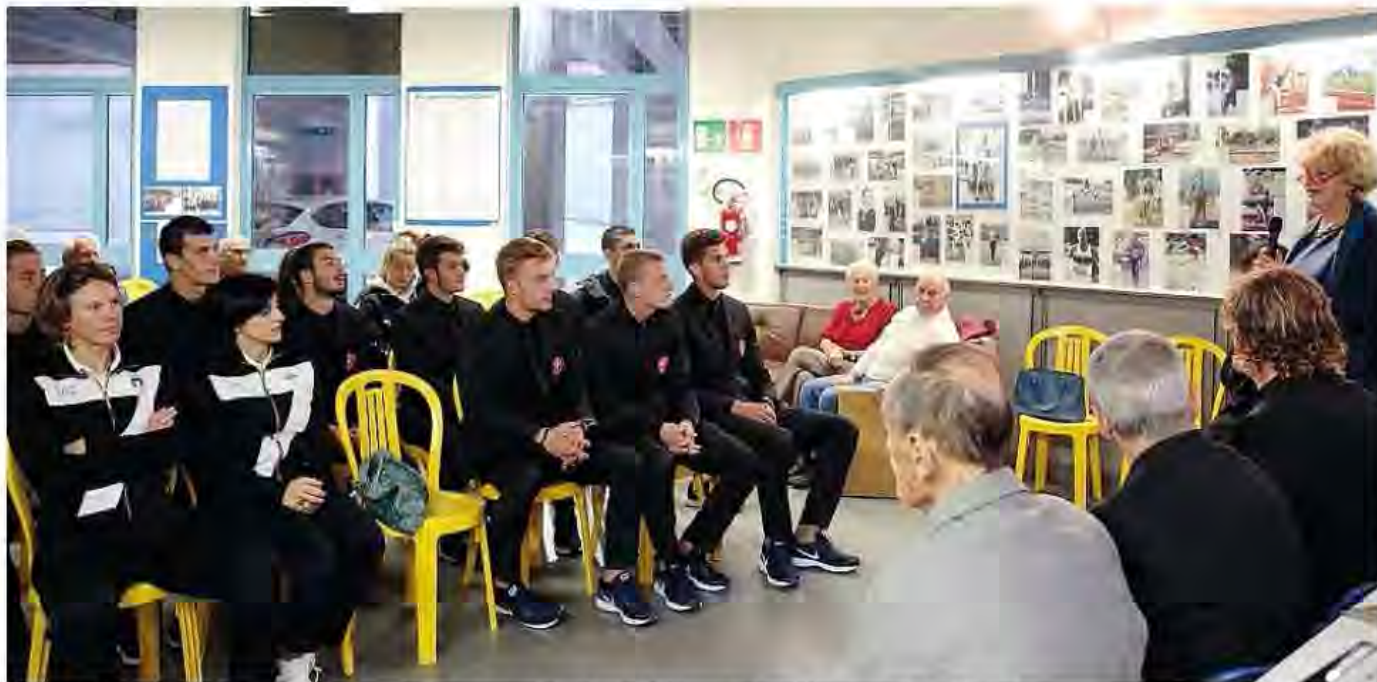
I ragazzi della Triestina assieme agli Azzurri nell'incontro che si svolse ieri sera allo stadio Rocco.