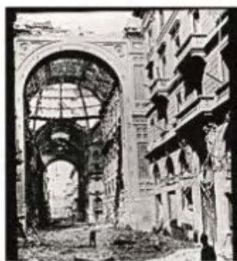
Galleria V. Emanuele bombardata