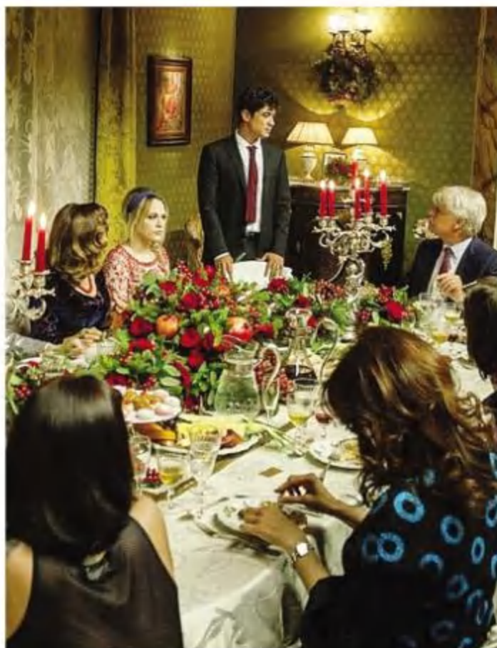
«La cena di Natale» in numerose sale della provincia

Multisala Gemini Via Palazzolo - 0307460530 SULLY Orari: 20.15; 22.00 FRANTZ Orari: 19.00; 21.15