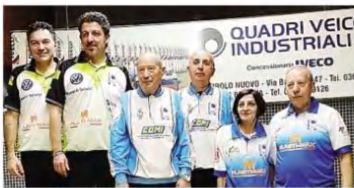
Le tre coppie vincitrici della gara disputata a Canonica d'Adda