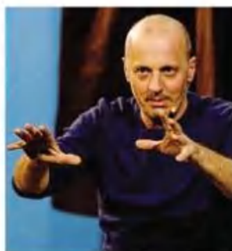
Marco Paolini torna in teatro

Qual è il rapporto che ciascuno di noi ha con la tecnologia? Marco Paolini torna in teatro con «Numero primo», suo nuovo spettacolo scritto insieme a Gianfranco Bettin, in prima nazionale alla Corte di Genova: «Una storia che racconta di un futuro probabile fatto di cose, bestie e orizzonti immaginati».