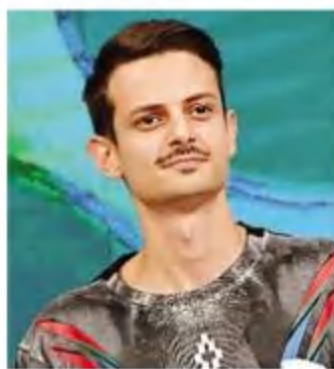
Fabio Rovazzi oggi a «X Factor»

La finale al Mediolanum Forum di Assago è sempre più vicina. Ma i concorrenti, nel sesto appuntamento live di X Factor 2016, in onda oggi alle 21,15 su Sky Uno Hd, dovranno fare i conti con una doppia manche e un opening scelto dal pubblico. Ospiti Skin con gli Skunk Anansie e il rapper Fabio Rovazzi.