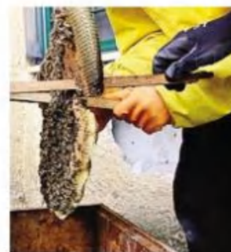
Un frame de «Il tempo delle api»