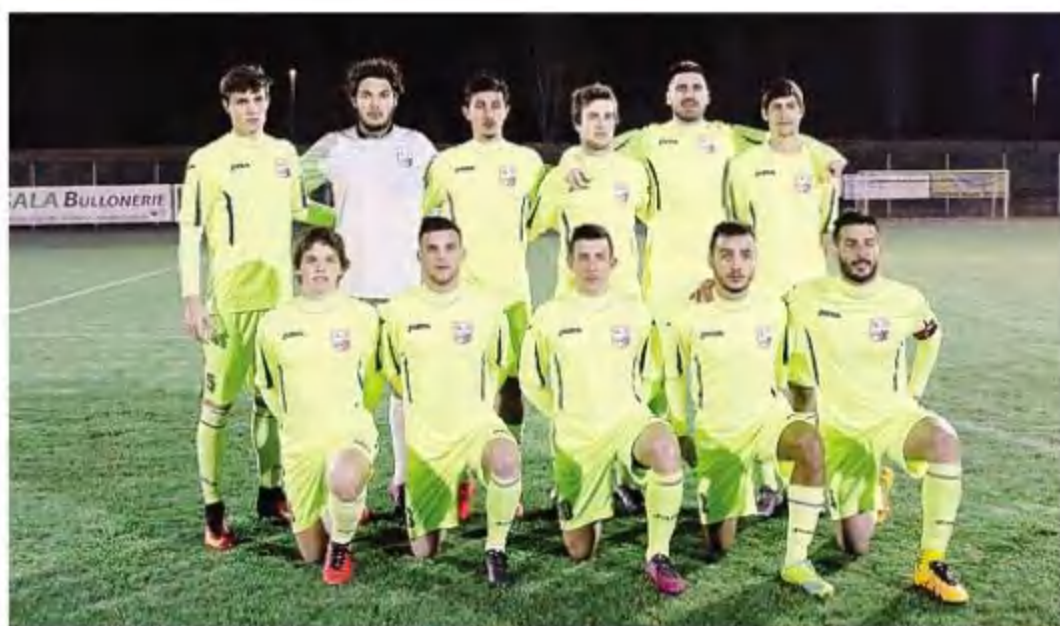
Il Calcio Romanese sceso in campo ieri sera a Verdello per la semifinale regionale di ritorno di Coppa Italia

Eccezionale non si può dire che, questa volta, il Calcio Romanese non se la sia meritata: coronando uno strepitoso percorso netto (seigare disputate, sei vittorie), nel doppio confronto con il Verdello i bassaioli hanno saputo incendiare le loro prestazioni con quei guizzi che, invece, sono mancati al team