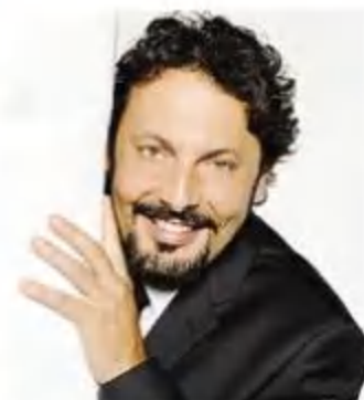
Il comico Enrico Brignano

Cinquant'anni tondi tondi, ovvero mezzo secolo di saggezza e 30 anni di carriera. Dopo il successo di «Evolushow», Enrico Brignano si rimette in discussione e torna in scena con «Ricomincio da me», nuovo show in scena all'Alfieri di Torino. Un viaggio a ritroso nel tempo attraverso ciò che è stato.