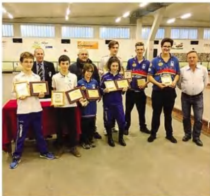
I campioni provinciali 2016: si è gareggiato nel bocciodromo cittadino