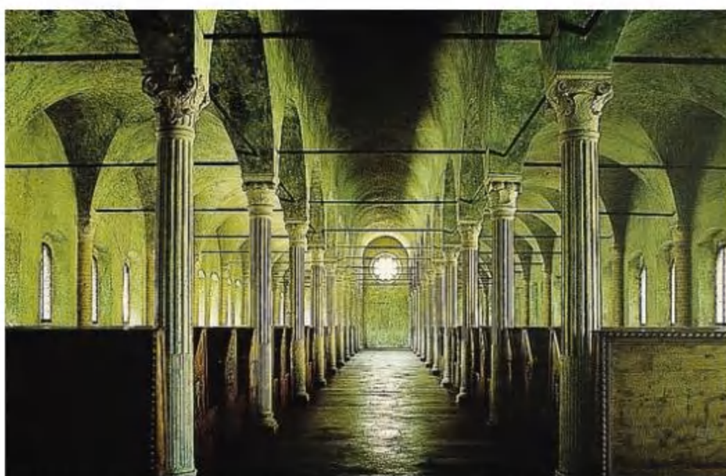
La biblioteca Malatestiana al centro di una puntata della nuova serie «Una biblioteca, un libro»