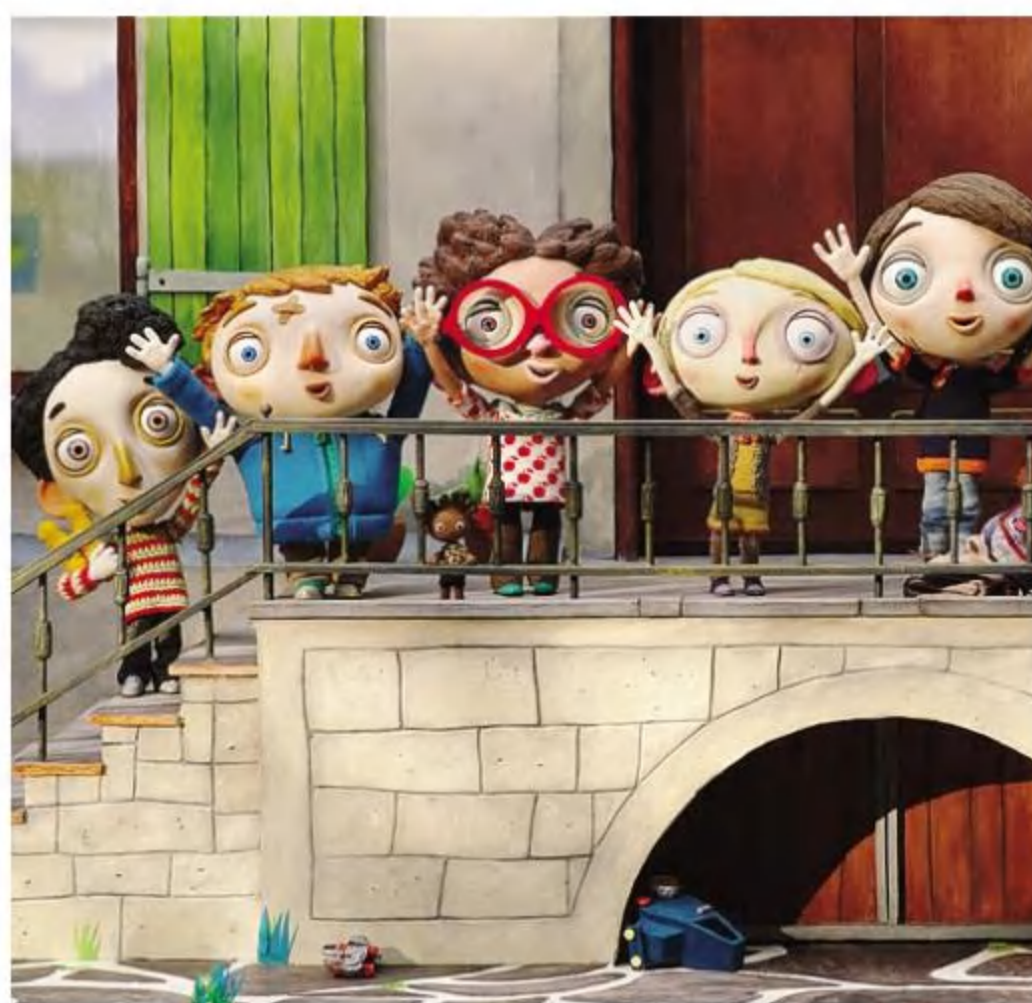
Una scena del toccante film d'animazione «La mia vita da Zucchini»