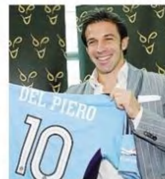
Alessandro Del Piero