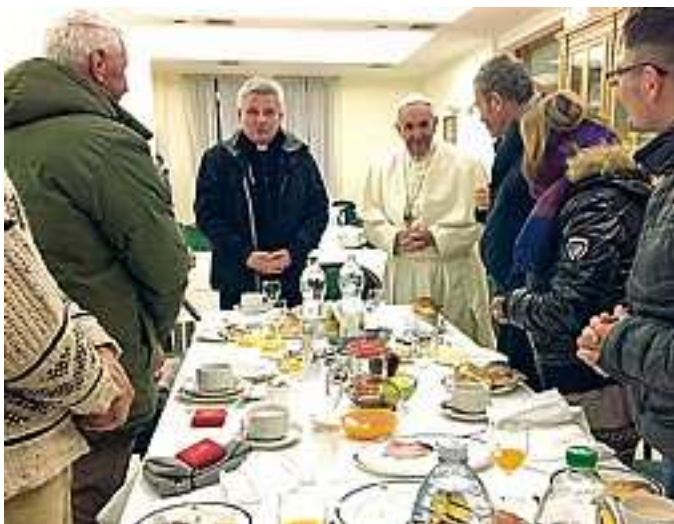
Papa Francesco a colazione con otto senzatetto a Santa Marta

volta uno spazio speciale ai poveri. Prima della messa nella Cappella Paolina con i cardinali, in cui ha chiesto «al Signore la grazia di un po' di umorismo ispirato per aiutarci ad andare avanti», il Pontefice ha invitato otto senzatetto di diverse nazionalità a fare colazione con lui a Santa Marta. Il gruppetto, sei uomini e due donne, era arrivato con tre mazzi di girasole per il Santo Padre. Lui, dopo averli salutati affettuosamente uno per uno, li ha accompagna-