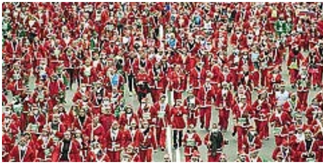
La corsa di Madrid ha coinvolto oltre 20 mila Babbi Natale

STESSA INIZIATIVA IN TANTE CITTÀ DEL MONDO