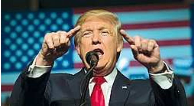
Donald Trump, 70 anni, si insedierà alla Casa Bianca il 20 gennaio

ALTA TENSIONE. MA LA CINA: «LO RESTITUIREMO»