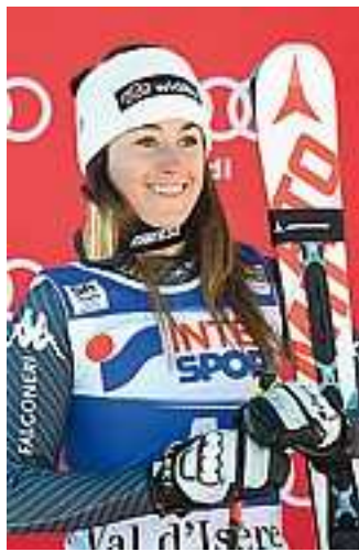
Il sorriso di Sofia Goggia, 24 anni, bergamasca

(a.a.) Quattro azzurre tra le prime sei: un solo precedente. Nel superG di Soldeu il 27/2/16: Brignone 1°, Goggia 4°, E. Fanchini 5°, Schnarf 6°