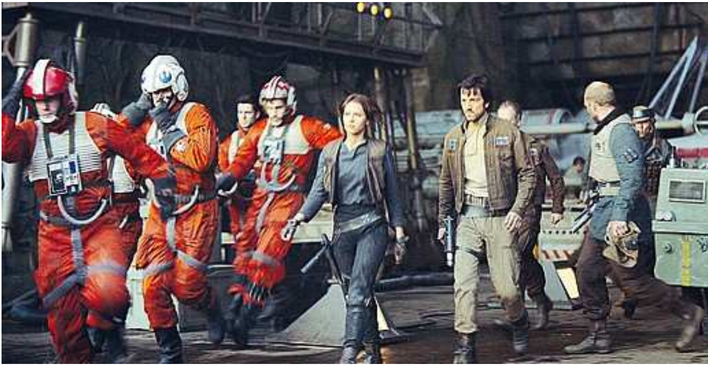
Una scena di «Rogue One», titolo che fa riferimento a un segnale militare: al centro, Felicity Jones, 32 anni e Diego Luna, 36