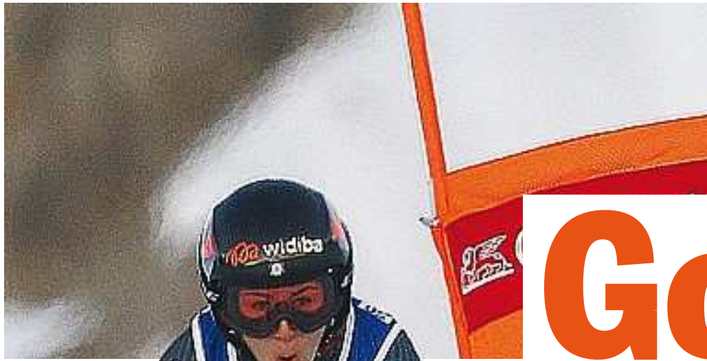
Christof Innerhofer, 31 anni, a sin., e Sofia Goggia, 24