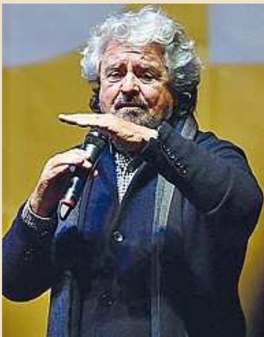
A sinistra, la sindaca di Roma Virginia Raggi, 38 anni, lascia il vertice di maggioranza a Roma; sopra, Beppe Grillo, 68 anni, fondatore dell'M5S