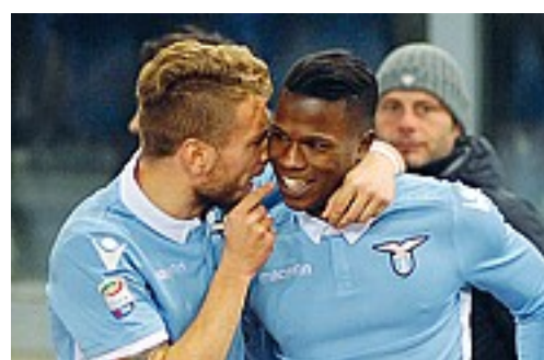
Ciro Immobile, 27 anni, e Keita Balde Diao, 22: serata si

Il bomber biancoceleste (17° gol) segna, Maxi Lopez replica, poi il senegalese e Anderson siglano il 3-1. Belotti si batte ma non basta