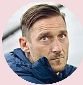
Francesco Totti, 40