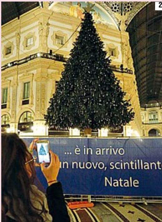
1 La pista di ghiaccio tra i grattacieli di piazza Gae Aulenti, che resterà attiva fino al 12 febbraio 2 L'albero di Natale già allestito nella Galleria Vittorio Emanuele II