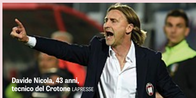
Davide Nicola, 43 anni, tecnico del Crotone