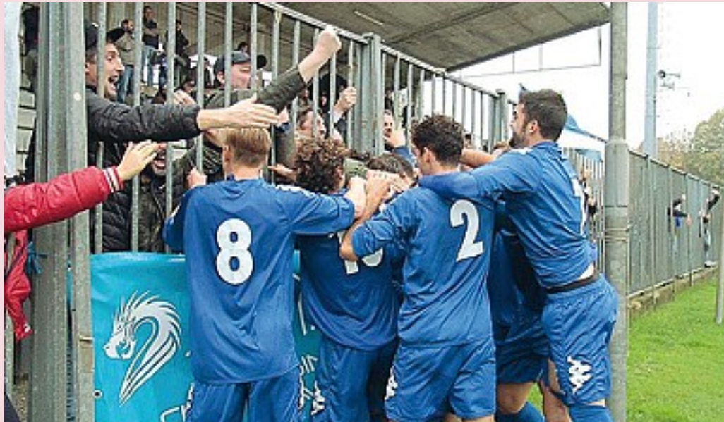
L'esultanza dopo un gol del Pavia, quarto nel girone A del campionato di Eccellenza

M illecinquacentocinque società affiliate, di cui 270 di puro settore giovanile; 9081 squadre iscritte ai campionati, fra cui 2031 prime squadre (dall'Eccellenza alla Terza Categoria; il calcio a 5 dalla C1 alla D e femminile; il calcio femminile di Serie C e D) e 6978 giovanili; 105.402 partite disputate nella stagione 2015/16 da 175.140 atleti tesserati, fra i quali oltre 118.000 sono ragazzi di settore giovanile. Tredici delegazioni provinciali con 219 fra delegati, dipendenti e collaboratori: questo è il Comitato regionale lombardo della Lega nazionale dilettanti, il più grande d'Italia, che sabato scorso ha visto la rielezione di Giuseppe Baretto, presentatosi come candidato unico, alla presidenza. Bergamasco classe 1949, ex bancario ed ex dirigente di una di queste società, è entrato nel Comitato il 1° novembre del 2000 all'epoca della presidenza Mileti; nel 2007 si sposta alla delegazione di Bergamo, per poi tornare nel 2009 come vice presidente vicario di Felice Belloli. Quando questi viene chiamato a Roma come numero uno della Lnd, il 1° dicembre 2014 Baretto assume la presi-