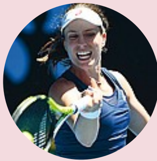
Johanna Konta, 26 anni, n. 10

Cina Taipei 4-1; Romania - Belgio 1-3; Ucraina - Australia 3-1. World Group I Repubblica Ceca- Spagna 3-2 Ieri: Martinez/Sorribes (Spa) b. Safarova/Siniakova (R. Cec) 6-3 4-6 10-7; Strycova (R. Cec) b. Arruabarrena (Spa) 6-4 6-4; Ka. Pliskova (R. Cec) b. Muguruza (Spa) 6-2 6-2. Svizzera-Francia 3-1 Bencic (Svi) b. Parmentier (Fra) 6-3 6-4; Bacsinszky (Svi) b. Mladenovic (Fra) 7-6(4) 4-6 7-5. Bielorussia-Olanda 4-1 Govortsova/Lapko (Bie) b. Burger/Rus (Ola) 6-4 6-2; Sabalenka (Bie) b. Krajicek (Ola) 7-6(5) 6-4; Sasnovich (Bie) b. Bertens (Ola) 6-3 6-4.