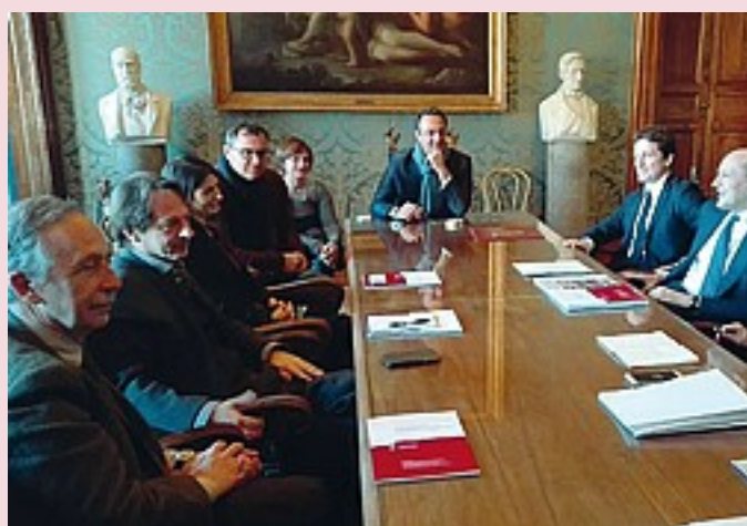
Domani o mercoledì la Raggi incontrerà la Roma e Parnasi OMNIROMA

LIGHT Chiaro. Finalmente chiaro dove va a parare quel «rispetto delle regole», che prima faceva tremare i polsi perché lasciava presagire un taglio draconiano del progetto, ma ora, da quando è scoppiato il Berdinigate , annuncia, o almeno dovrebbe, una riduzione light del-