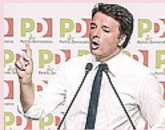
Matteo Renzi, 42 anni

● Si dimette, non si dimette: è la domanda che troverà risposta oggi con l'attesa direzione del Pd in programma a Roma. Il segretario Matteo Renzi avrebbe deciso di lasciare e convocare il congresso del partito, convinto di rivincere e avvicinare, così, la data delle elezioni a giugno, massimo a settembre. I possibili sfidanti rimangono guardinghi,