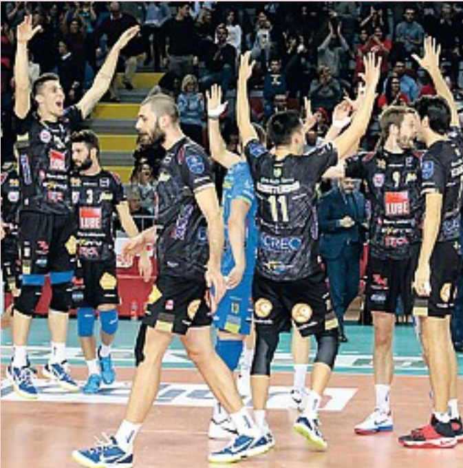
La Lube Civitanova colleziona la vittoria n. 16 con Trento

OBIETTIVO CENTRATO «Ci tenevamo a chiudere il discorso per non lasciare speranze — ammette il pragmatico Osmany che non vuole celebrare troppo -. Grande differenza in campo? Mah, stiamo giocando bene, siamo riusciti a metterli in difficoltà negli ultimi due set mentre nel primo abbiamo sbagliato qualcosa di troppo.