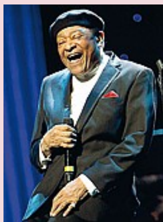
Al Jarreau si era appena ritirato

● Sarà più facile ottenere l'ambito passaporto elvetico per i nipoti di immigrati, tra i quali molti italiani, nati e cresciuti in Svizzera. Ieri alle urne gli elettori della Confederazione hanno approvato col 60,4% la modifica costituzionale per la più agevole naturalizzazione dei giovani stranieri di terza generazione. Vince il sì in 19 Cantoni su 26.