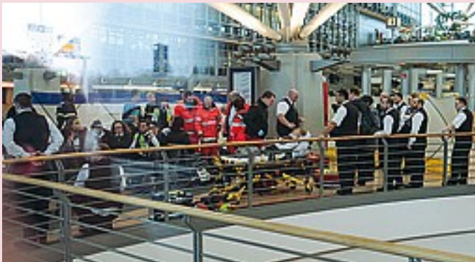
I primi soccorsi nello scalo tedesco: 68 persone intossicate

LE AUTORITÀ RASSICURANO: «NON È ATTENTATO»