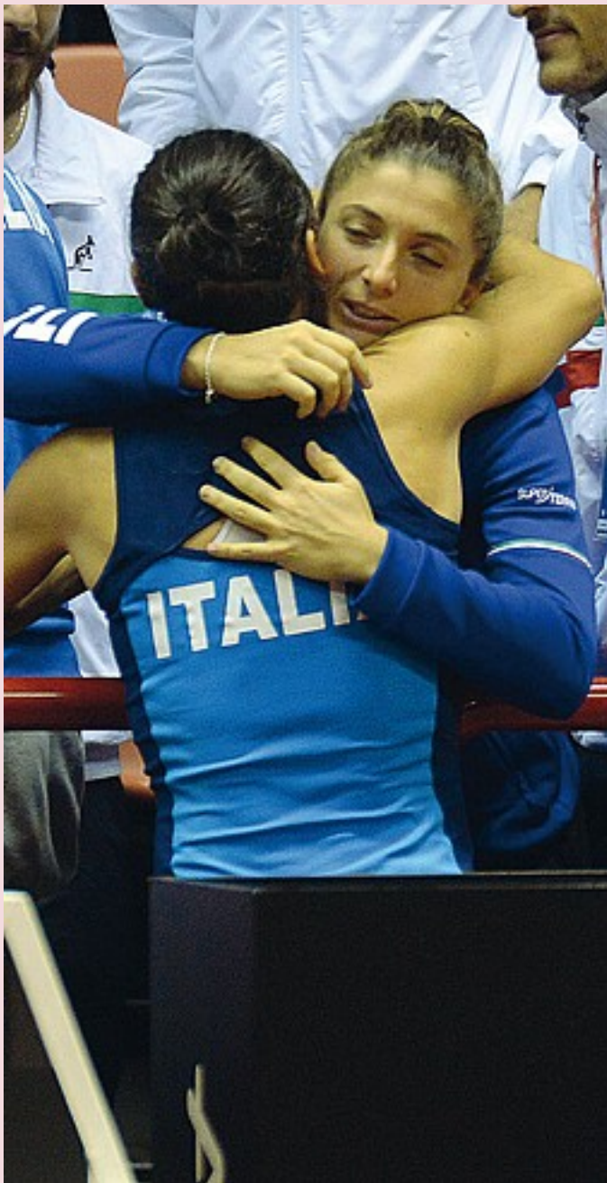
L'abbraccio tra Sara Errani, 29 anni, e Francesca Schiavone, 36