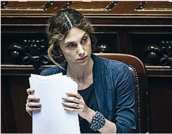
Marianna Madia, ministro della Pubblica amministrazione

LINEE Sono queste le linee guida della riforma che il ministro della Semplificazione e della Pubblica amministrazione, Marianna Madia, sta preparando con il dipartimento per le Pari opportunità, puntando su misure che possano migliorare la conciliazione vita-lavoro. Intanto si parte da quanto stabilisce la riforma Madia, in cui si prevede