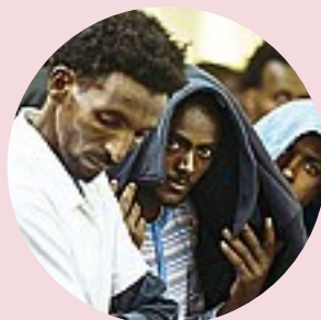
Centro accoglienza migranti

SALVINI Sulla vicenda era già prontamente intervenuto il segretario della Lega Nord Salvini: «Per qualche buonista il sindaco di Vitulano ha sbagliato, per me ha fatto bene! Il sindaco è del Pd: razzista, populista e leghista anche lui...?».