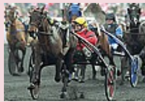
Bold Eagle domina FORNÌ

T roppo forte Bold Eagle. Non c'è molto da aggiungere a quello che già si sapeva. Il fenomeno francese non si ferma davanti a niente e nessuno, conquistando il France con una semplicità disarmante. Il figlio di Ready Cash ha realizzato il doppio con l'Amérique per il secondo anno consecutivo: ora è a una sola tacca da Ourasi, che ci riuscì per tre anni di fila (1986, 1987 e 1988).