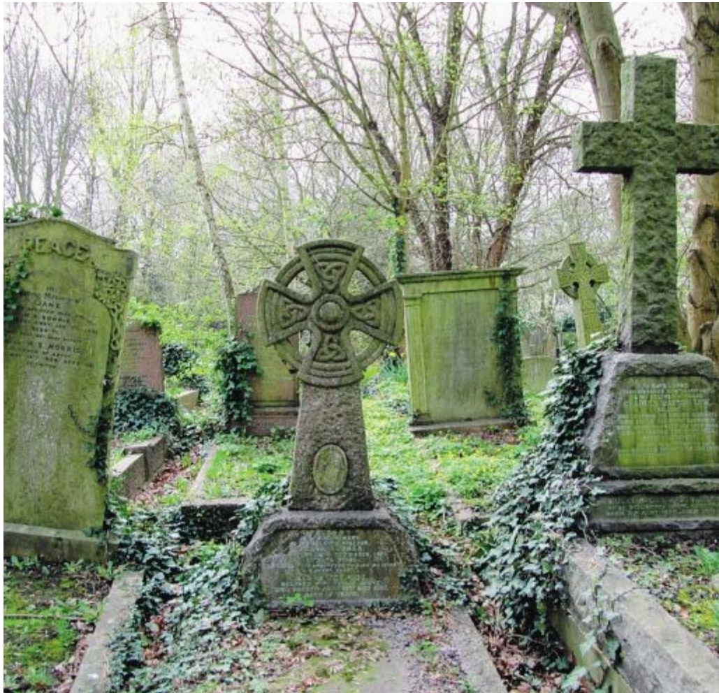
DARK TOURISM Sopra, il cimitero di Highgate a Londra. In alto, una parete di ossa a San Bernardino

Nel 2017, complice anche il web e le decine di leggende che si possono trovare online, il turismo macabro si è ulteriormente trasformato, diventando un vero e proprio