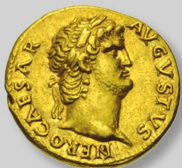
L'aureo di Nerone Impero Romano 54/68 d.C.

MONETE E FRANCOBOLLI valori preziosi che durano nel tempo