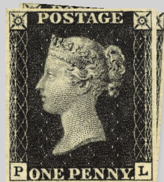
Penny Black Gran Bretagna, 1840 il primo francobollo del mondo