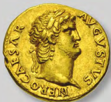
L'aureo di Nerone Impero Romano 54/68 d.C.

MONETE E FRANCOBOLLI valori preziosi che durano nel tempo