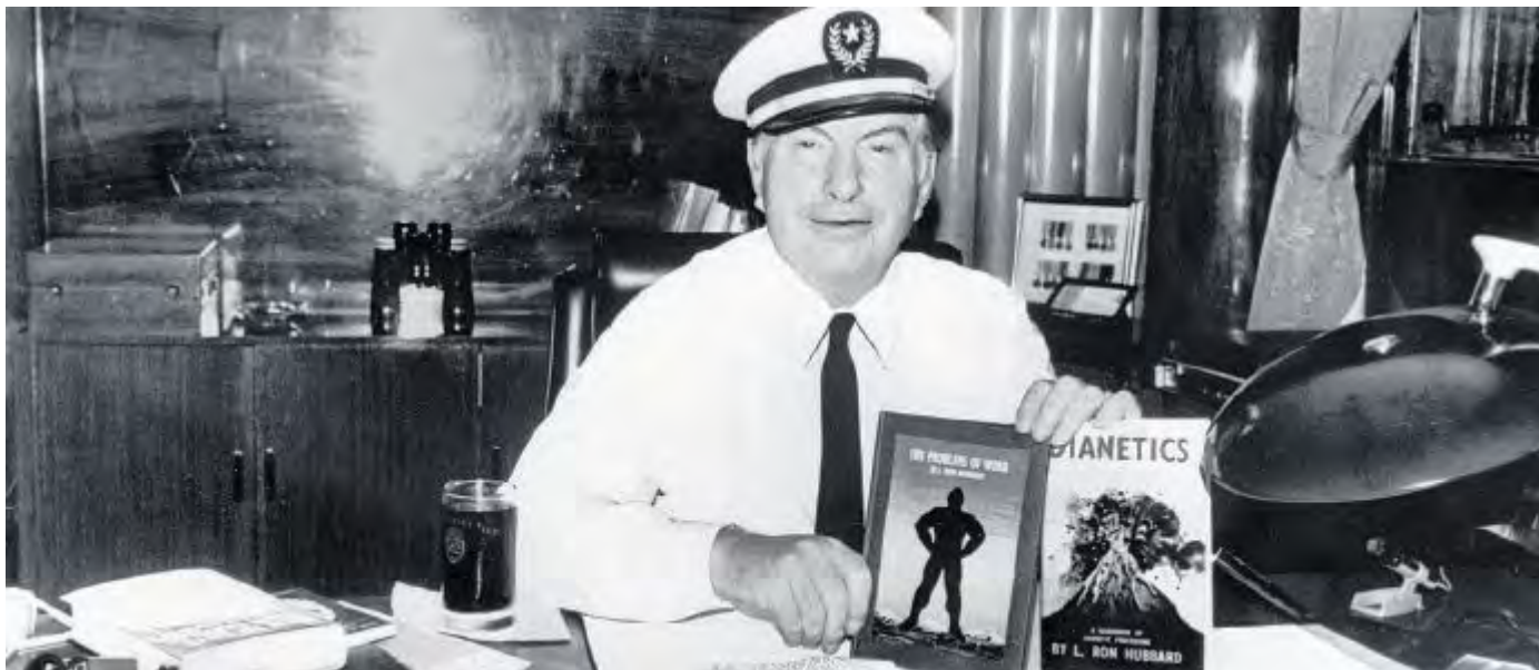
IMMORTALE Per il fondatore Ron Hubbard, Scientology è un processo che deve portare il seguace a esaltare un teorico potenziale d'immortalità