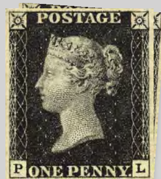
Penny Black Gran Bretagna, 1840 il primo francobollo del mondo