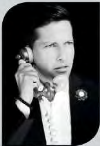
POR CARLOS GUERRERO WARRIOR @carloslguerrero