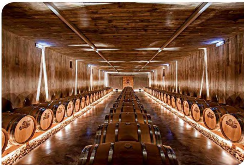
CASTILLO DE YGAY - MARQUÉS DE MURRIETA

Otra parada, fuera de Laurel, es Wine Fandango, un sitio muy chic para salir por la noche. Tienen más de 200 etiquetas de todo el mundo. Su selección los hizo ganadores del premio Best of Wine Tourism 2017 y