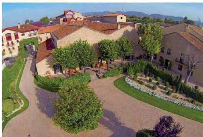
LA RIOJA ALTA

su coctelería con vinos y espumosos es sorprendente.