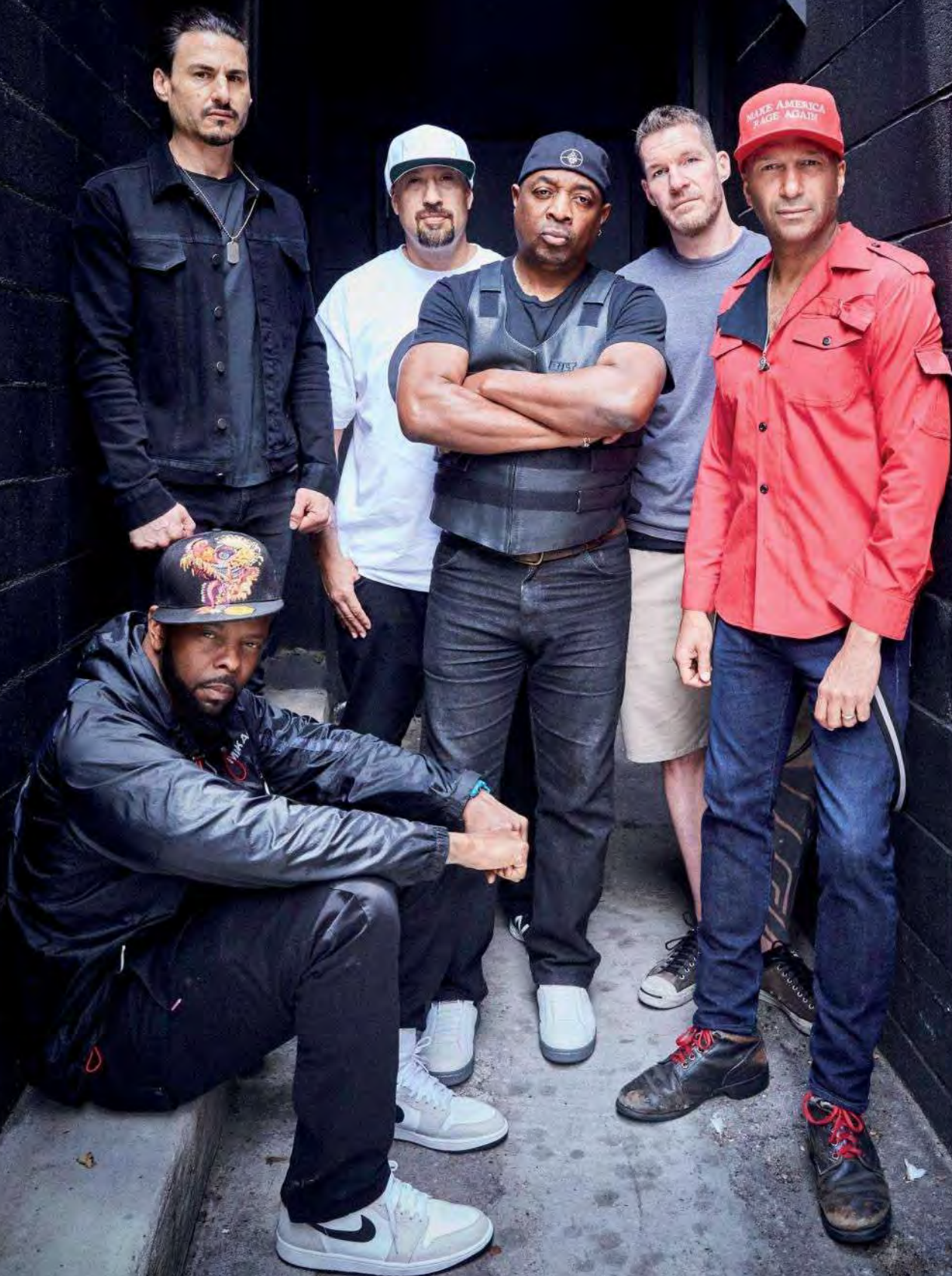
PROPHETS OF RAGE