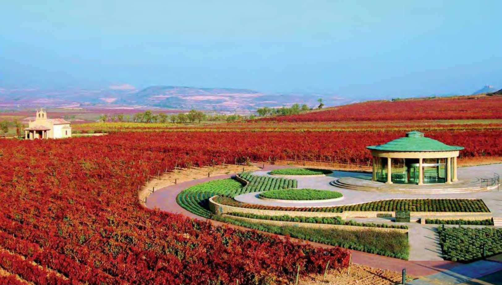
FINCA EL CENTILLO - VIVANCO

Si eres de los que siempre soñó con adentrarse en laberintos, Marqués de Murrieta es para ti. Ubicada en Rioja Alta, es un castillo que funciona como bodega. Está rodeado por treinta viñedos, con vides antiguas (de hasta 90 años) y una posición privilegiada que le permite tener climas continental y mediterráneo.