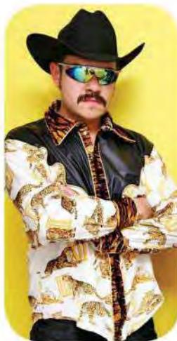
Sólo los valientes irán 3 de marzo 21:00 horas Pasagüero (Motolinía 33, Centro)

En este mes de marzo, Los Master Plus relanzarán este EP en edición de lujo con tres canciones nuevas. Una de ellas lleva por título