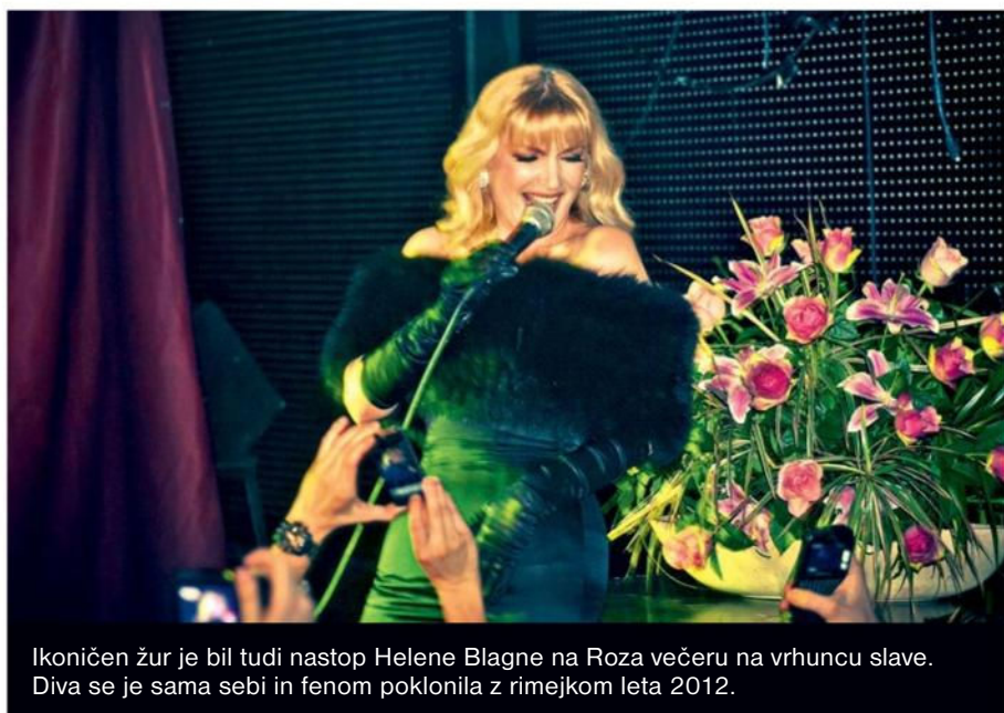
Ikoničen žur je bil tudi nastop Helene Blagne na Roza večeru na vrhuncu slave. Diva se je sama sebi in fenom poklonila z rimejkom leta 2012.

Pa še na eno pomembno dejstvo opozarja Kekićeva: »K4 ostaja tudi prostor za učenje, rast, promocijo in mreženje ustvarjalcev urbane scene, od didžejev in glasbenikov do vidžejev, plesalcev, brejkerjev, raperjev, oblikovalcev, fotografov in street artistov. Temu so namenjene delavnice, torkova druženja, na katerih lahko na ozvočenju K4 stestiraš komad in dobiš kak nasvet prekaljenih mačkov. V te projekte bomo skušali še bolj pritegniti tuje goste. Glavni protagonisti sezone 2016/17 bodo sicer domače ekipe, ki bodo na svojih večerih kdaj gostile tudi kakšno sveže svetovno ime, a radi bi, da čim več obiskovalcev spozna naše ustvarjalce in se vrača zaradi njih.«