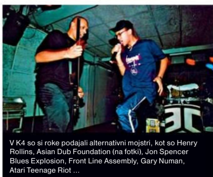
V K4 so si roke podajali alternativni mojstri, kot so Henry Rollins, Asian Dub Foundation (na fotki), Jon Spencer Blues Explosion, Front Line Assembly, Gary Numan, Atari Teenage Riot ...