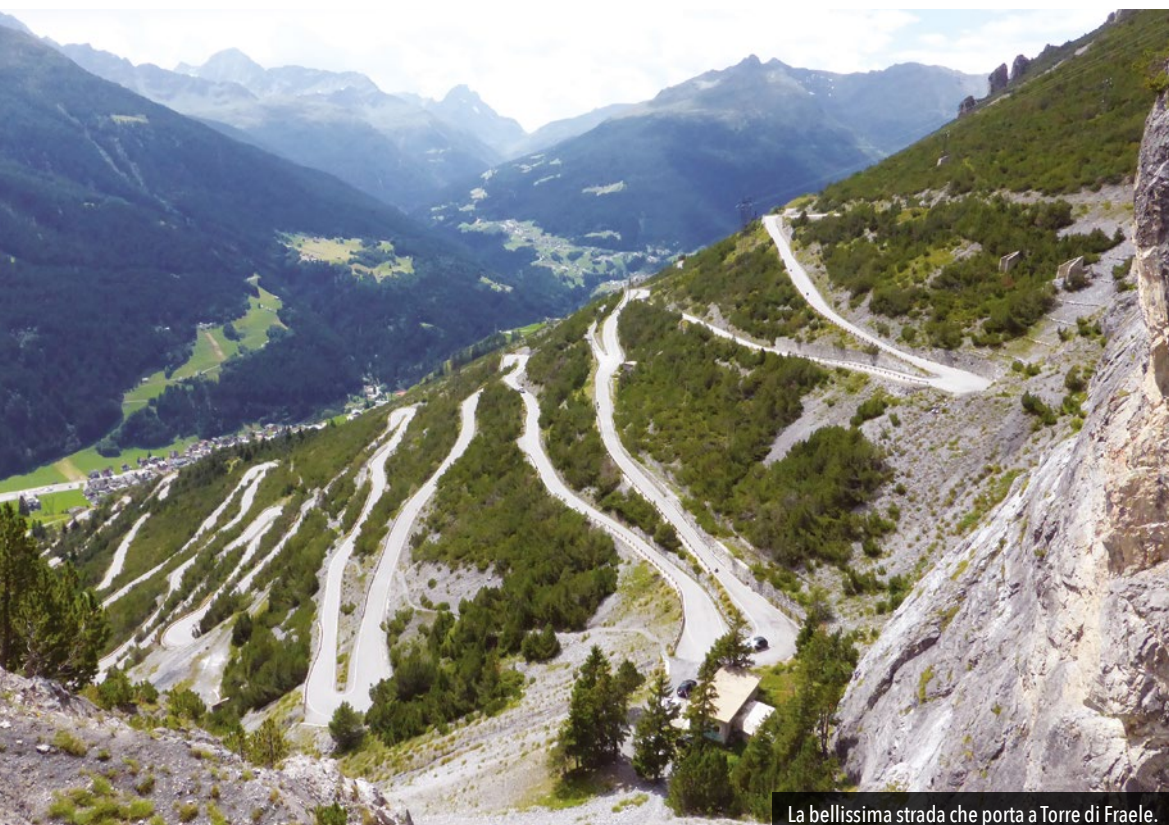
La bellissima strada che porta a Torre di Fraele.

i tornanti, che ci accompagneranno sino alla vetta. Ormai è fatta, la commozione inizia a farsi sentire. Nonostante l'altitudine, il monocilindrico continua a spingere senza perdere un colpo, usciamo dall'ultimo tornante e pochi metri dopo passiamo a fianco del mitico cartello che indica i duemilasettecentocinquanta metri del passo dello Stelvio. Parcheggiamo la moto in uno dei rari posti liberi in cima al passo, guarda caso vicino a uno splendido California II. La moto non ha la chiave di accensione, per spegnerla chiudiamo i rubinetti della benzina, pensando che sicuramente a quella altitudine il minimo non reggerà più di qualche secondo... e invece, ecco che continua a pulsare con un battito lento, quasi conti i giri del volano. Subito accorrono numerosi motociclisti ad ascoltare la superba musica e non si contano i telefonini che iniziano a riprendere il mitico "Guzzi single sound". Emozioni su emozioni, che spettacolo!