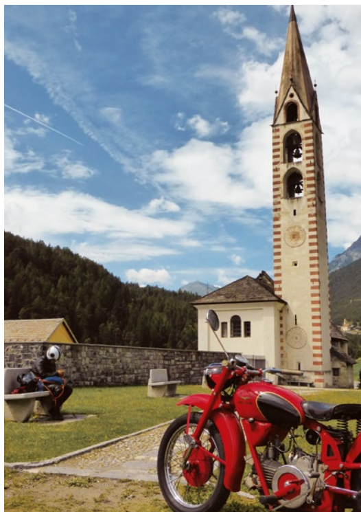
Sopra: chiesa di San Gallo a Premadio.

Risaliti in sella c'è l'ultima parete da superare, già si scorge il passo in lontananza: ricominciano