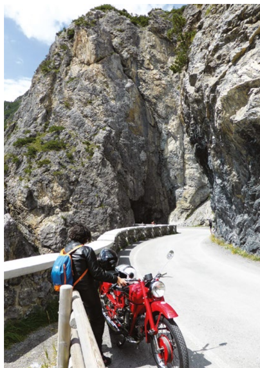
A sinistra: il centro di Bormio.