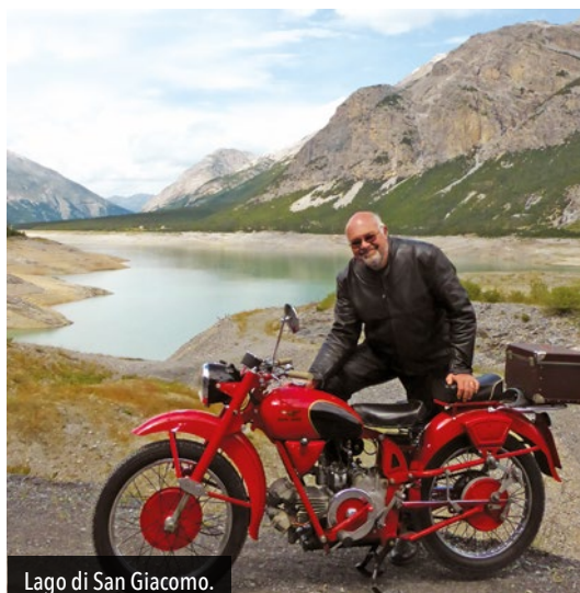
Lago di San Giacomo.

Per una piacevole esperienza nella natura ed emozioni sul fiume Adda, in Valtellina.