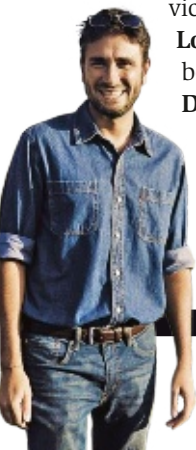
ALESSANDRO DI BATTISTA a Senigallia, Gaeta, Bagheria.