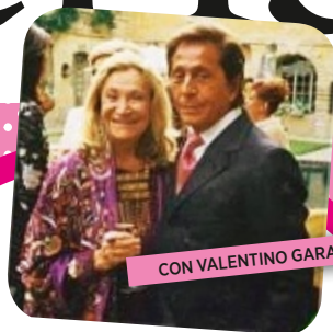
CON VALENTINO GARAVANI