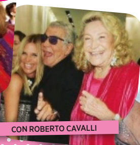
CON ROBERTO CAVALLI