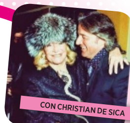
CON CHRISTIAN DE SICA