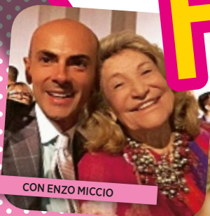
CON ENZO MICCIO