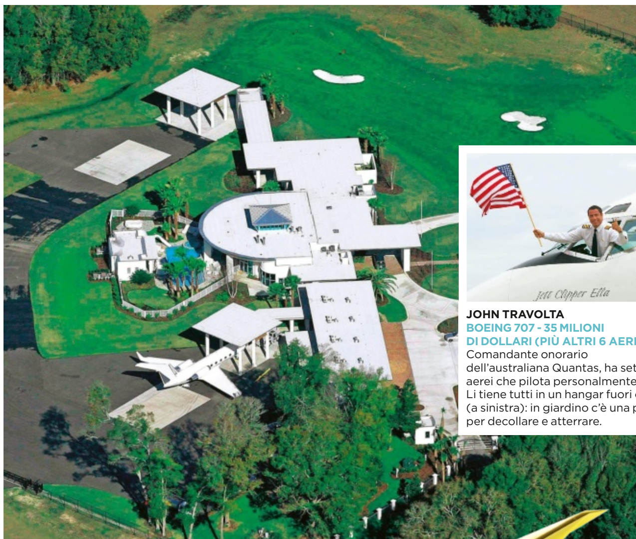
JOHN TRAVOLTA BOEING 707 - 35 MILIONI DI DOLLARI (PIÙ ALTRI 6 AEREI)

Comandante onorario dell'australiana Qantas, ha sette aerei che pilota personalmente. Li tiene tutti in un hangar fuori casa (a sinistra): in giardino c'è una pista per decollare e atterrare.