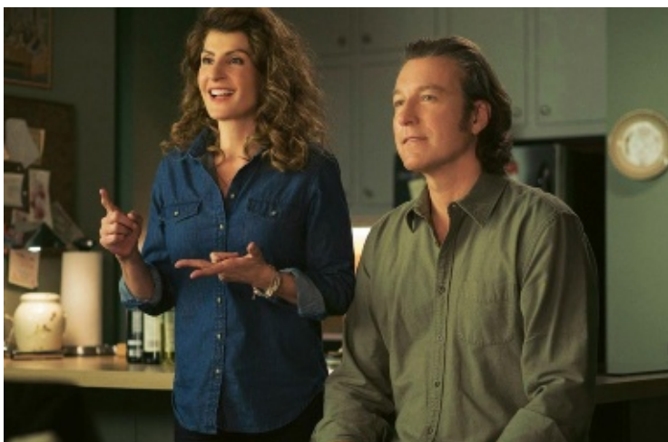
Nia Vardalos e John Corbett in una scena de Il mio grosso grasso grosso matrimonio greco 2 .