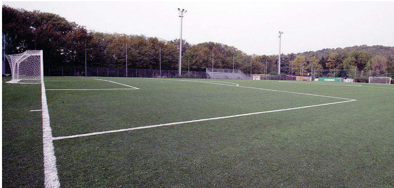
Uno dei campi da calcio di Borgo San Sergio