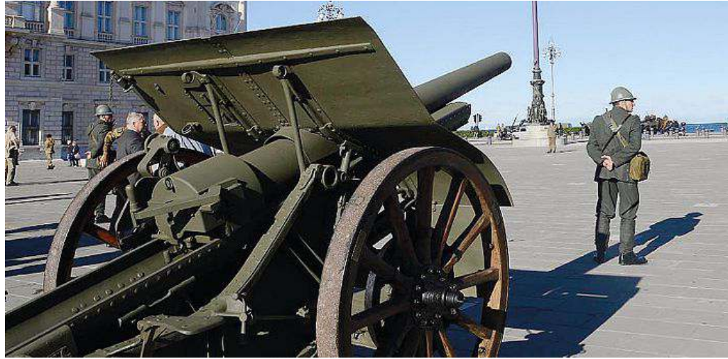
Un cannone e un soldato in divisa in piazza Unità in occasione della mostra "La Grande Guerra"

Se lo spirito con cui la Regione affronta la giornata è del tutto europeo e volto al superamento delle antiche divisioni, così non si può dire né della retorica dell'Evento Albo d'Oro né delle medaglie che con fondi