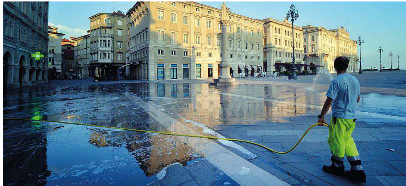
La pulizia di piazza Unità al mattino dopo una serata che aveva lasciato in eredità parecchi rifiuti