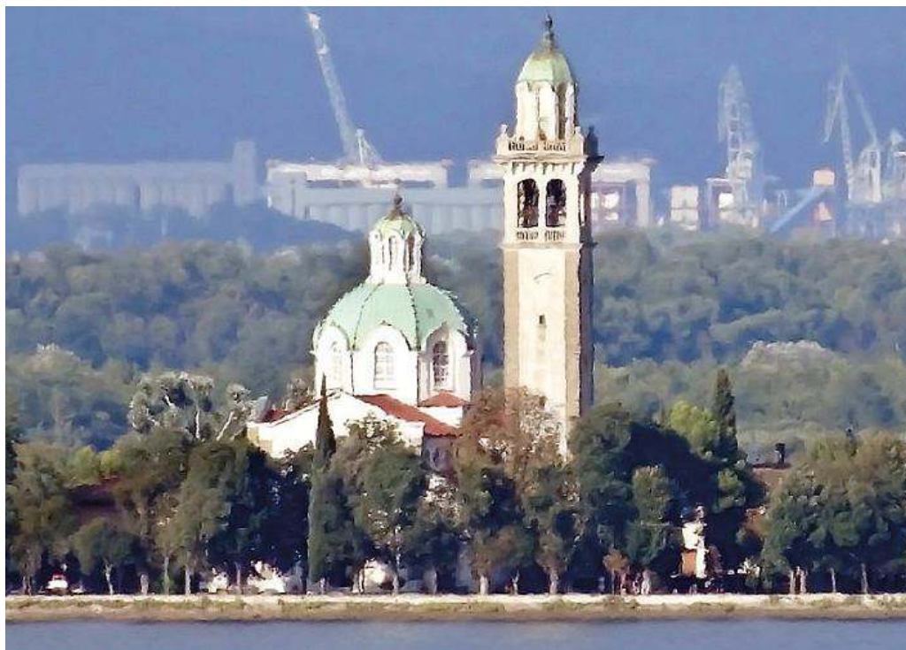
Il santuario di Barbana

del clacson di un mezzo industriale proveniente da Lignano e in procinto d'imboccare la A4. Si sono lanciati, sempre contromano, all'inseguimento dell'auto, una Seat Ibiza che è stata evitata all'ultimo istante da due auto provenienti da Lignano prima che la Polizia riuscisse a bloccarla. Il conducente era al volante con un tasso di alcol quattro volte superiore al consentito ed è stato denunciato. La polizia gli ha ritirato la patente e l'auto gli è stata sequestrata.