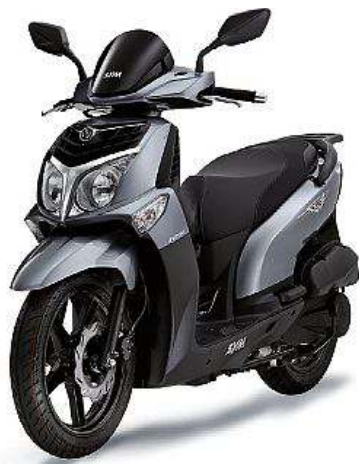
HD2 125 CBS - 200i