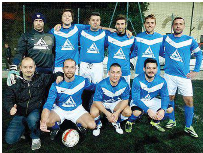
La squadra del Brada Impex, una delle due che si è ritirata dalla Coppa

Pugni in campo durante una partita a Borgo San Sergio. Intervengono i Carabinieri Bar Terzo Tempo e Brada Impex dicono addio allo storico torneo di calcio a sette