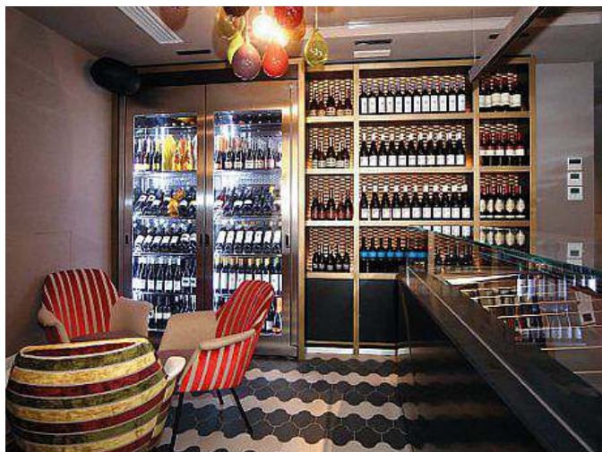
Dettaglio dei rinnovati allestimenti interni

noscibile. I colori cioccolato, bronzo e nero la fanno da padrone. L'architetto Rossella Gerbini che ha progettato la nuova Portizza ha disposto una serie di specchiature che vogliono evidenziare l'affaccio sul Tergesteo o piazza della