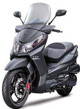
CITYCOM S 300i CBS

È ATTIVO IL SERVIZIO ASSISTENZA SPECIFICO E PLURIMARCA