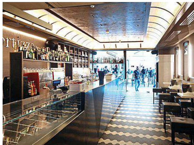
La nuova Portizza: il locale riapre oggi

Basta fare capolino per capire che il locale ha subito un radicale cambiamento. Partendo dal fatto che esternamente la porta di ingresso è stata spostata di un paio di metri. La rinnovata Portizza ha acquistato in