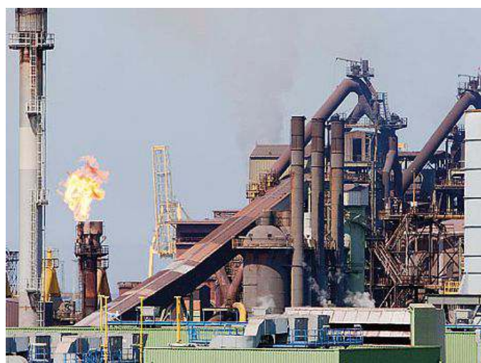
Il complesso della Ferriera