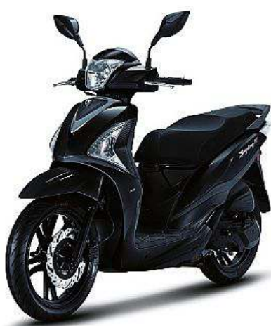
SYMPHONY ST 125 - 200