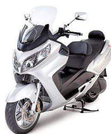
MAXSYM 400i ABS

* Esempio di finanziamento su SYMPHONY 125 ST prezzo di listino chiavi in mano euro 2.450 anticipo euro 250, 24 rate da euro 95,83 spese gestione pratica euro 100, 16 euro imposta di bollo SMPG 1,50 rata. Totale dovuto euro 2.352 T.A.N 0,00% T.A.E.G. 6,83 % salvo approvazione della finanziaria.