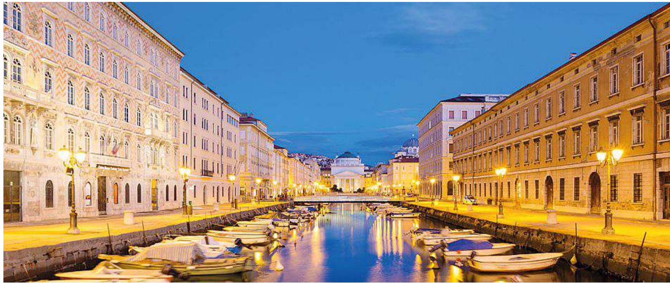
Una suggestiva veduta del Canal Grande

Secondo classificato il progetto dell'architetto Paolo Chierici di Bologna che ha all'attivo soprattutto progettazione di interni di lusso. La sua proposta prevede (una delle poche) il ripristino del Canal Grande "com'era e dov'era" con l'acqua che bagna il sagrato di Sant'Antonio. Un recupero dell'immagine storica dell'area con lo scavo dell'ultimo tratto del canale, la costruzione di un ponte su via San Spiridione e la piantumazione di due file di alberi a chiudere via Dante e via XXX Ottobre. Gli stessi alberi vietati dalla Soprintendenza in piazza Ponterosso (che sarà inaugurata oggi alle 18 alla pre-