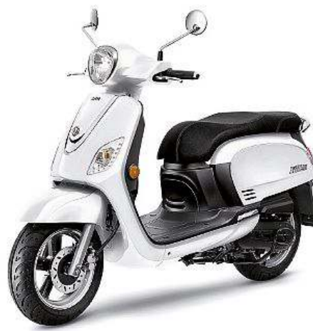
FRIDDLE III 50 - 125 - 200i CBS