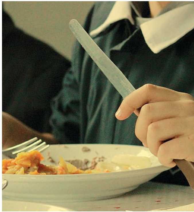
Aggiudicato il maxi appalto delle mense scolastiche