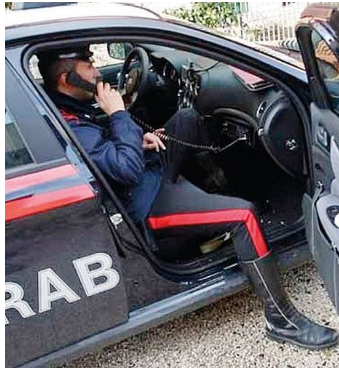
Una pattuglia del Radiomobile dei carabinieri