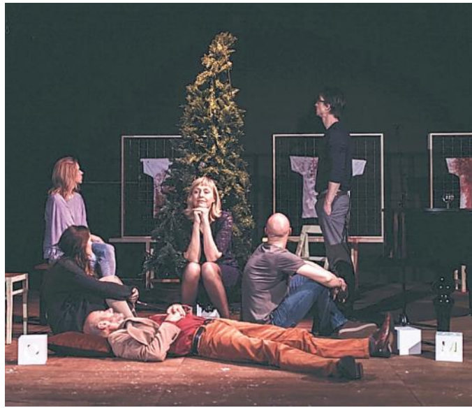
"Solstizio d'inverno" da venerdì al Teatro Sloveno di Trieste

È un dramma borghese di nuova generazione questo interno familiare assolutamente ordinario e riconoscibile: lui è uno scrittore e sociologo, lei una regista, due professionisti affermati e benestanti con una figlia adorabile. L'abete di Natale è in macchina, pronto per rendere ancora più accogliente un interno a metà strada tra il design della nota fabbrica svedese e il classico Biedermeier, con un vecchio pianoforte e una discutibile opera di un amico artista in salotto. Il rapporto teso con la suocera è un ulteriore elemento di convenzione,