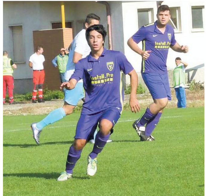
Lo Zaule Rabuiese sta disputando un ottimo campionato

late in un groppone pressoché uniforme: fanno un passo avanti, salvo poi fermarsi la domenica successiva. Vivono in una zona play-out allargatissima in cui diventano importanti i risultati dei derby, in cui tutte, comunque, hanno qualcosa da perdere. Difficile uscirne, ma nei prossimi quattro turni dovranno industriarsi per mettere le basi per un girone di ritorno meno pericoloso. Infine il Costalunga: incredibile che regga il fanalino di coda dopo i risultati della scorsa stagione, ma basta l'indisponibilità di qualcuno per far crollare le sicurezze. (g.b.)