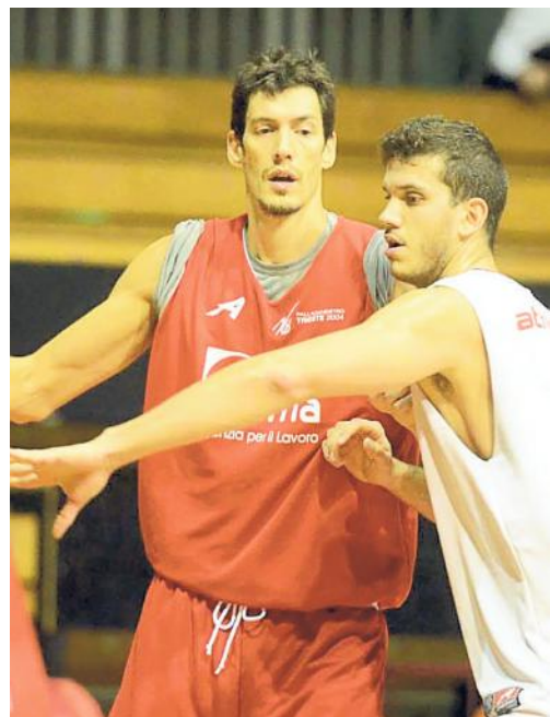
Primo allenamento di Cittadini con l'Alma