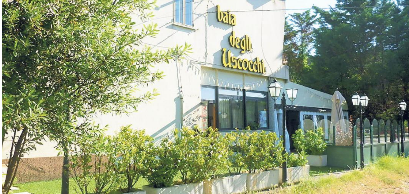
Il ristorante albergo "Baia degli Uscocchi" del Villaggio del Pescatore in una foto d'archivio

La Coop del Pesce s.r.l.s. già operava alla Baia degli Uscocchi in qualità di locataria dell'immobile. Con l'aggiudicazione di ieri si garantisce perciò una certa continuità nella gestione. Arrivare al risultato finale non è stato agevole: prima dell'apertura della busta di ieri, l'unica pervenuta, erano andate deserte due aste. Prima di arrivare a fissare il prezzo a 180mila