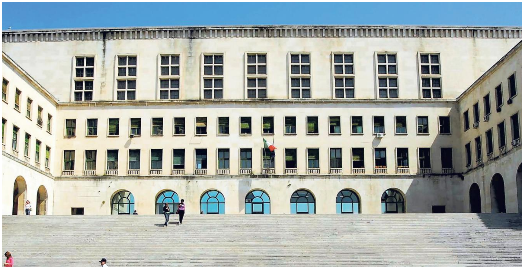
La sede centrale dell'Università di Trieste in piazzale Europa