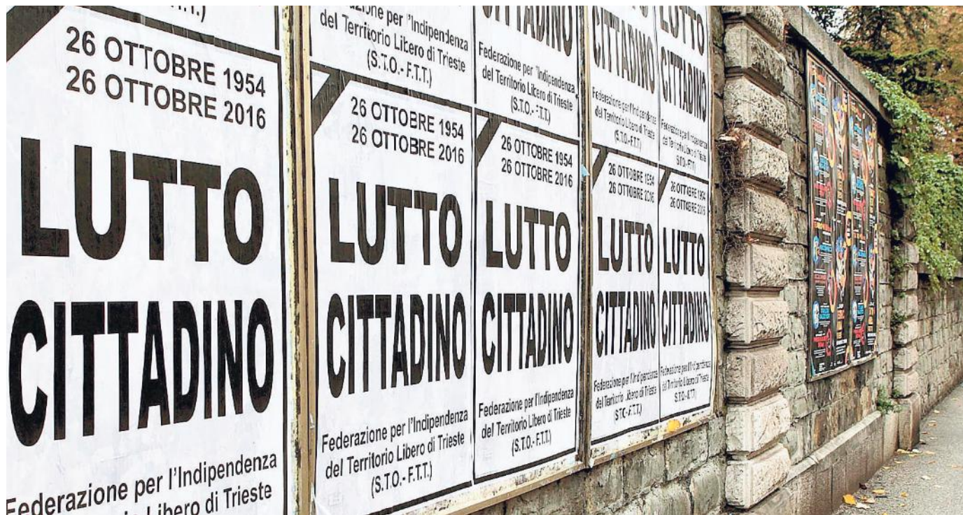
I manifesti della Federazione per l'indipendenza del Territorio libero di Trieste in piazza Ospedale

«Il "lutto cittadino" c'entra l'arrivo di Mattarella? «Ovvio. Che domande? - ride Marchesich -. Anche se è da anni che proclamiamo la giornata di "lutto cittadino" nella nefasta ricorrenza del 26 ottobre. La prima volta fu con Pertini presidente della Repubblica». La polemica sulla città listata a lutto è esplosa subito sui social. «Vergogna! Il Comune di Trieste è responsabile di questo