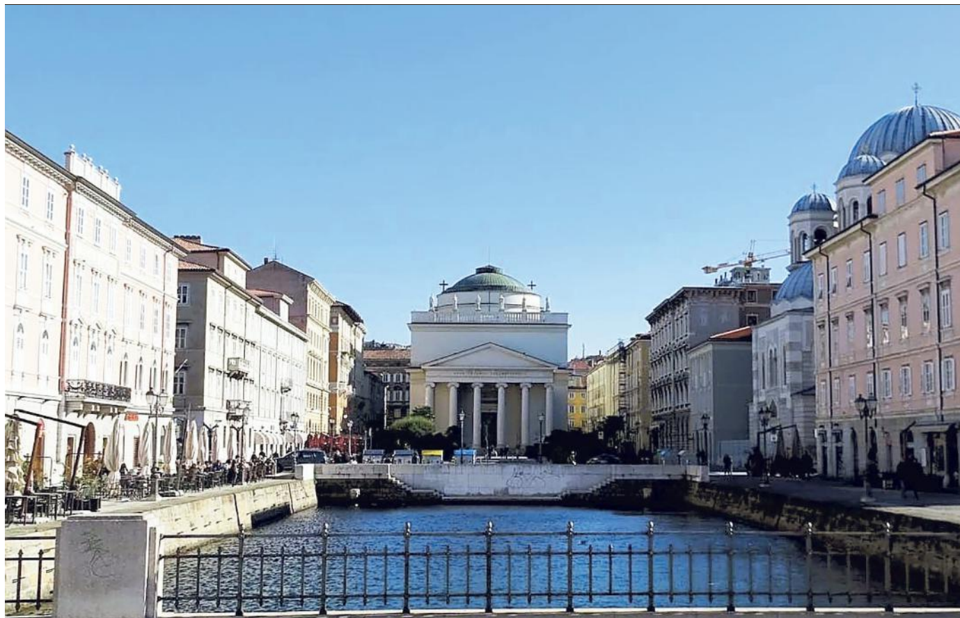
Una veduta di Ponterosso: si partirà da qui, domenica, per la passeggiata storico-culturale "La porta di Sion-Storia di Trieste e della sua comunità ebraica"