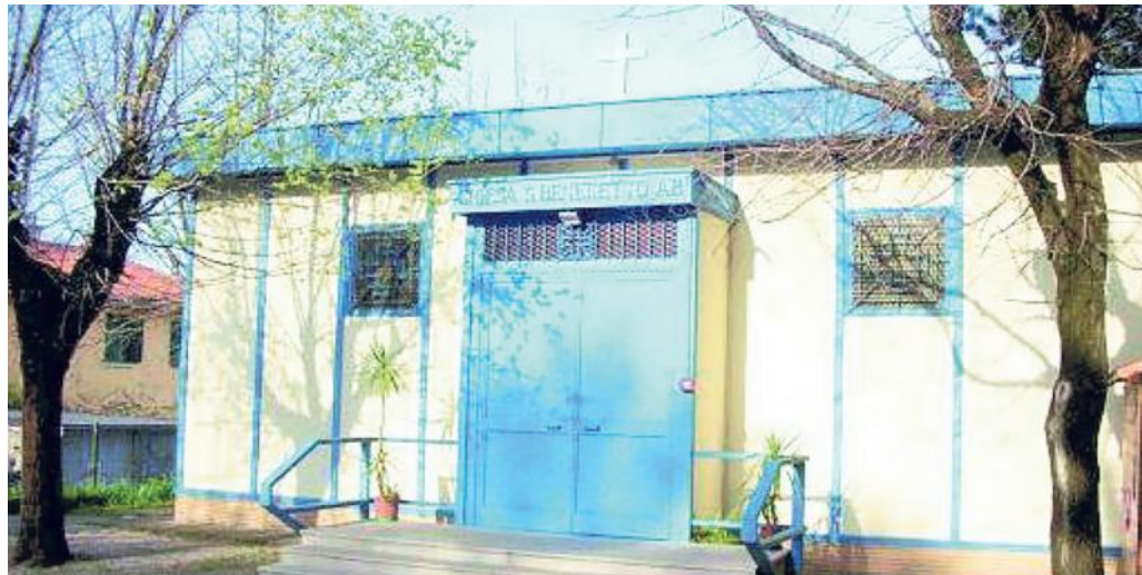
La chiesa di San Benedetto Abate ad Aquilinia

mine. Di fronte a un numero maggiore di persone rispetto ai posti letto disponibili, gli aiuti offerti dalle parrocchie di Aquil-