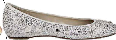
Di suède con cristalli, Loriblu .