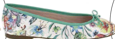
Di pelle stampata, Bailarinas by SKA .